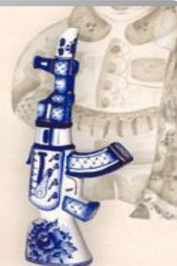
Штоф "Автомат" (0,5 л.)