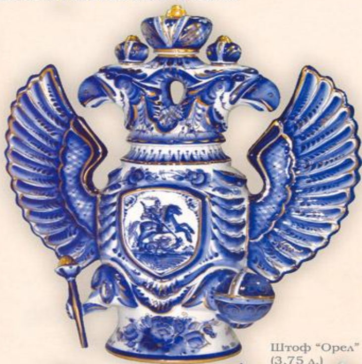
Штоф "Орел" (3,75 л.)