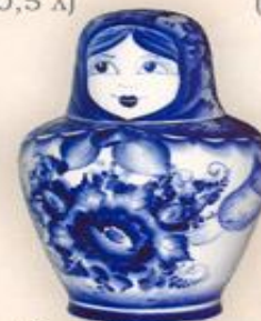
Штоф "Матрешка" (0,75 л.)