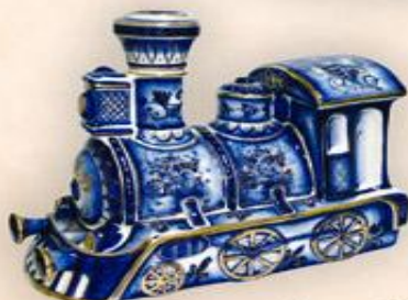
Штоф "Паровоз" (1,0 л.)