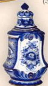
Штоф "Весенний" (0,75 л.)