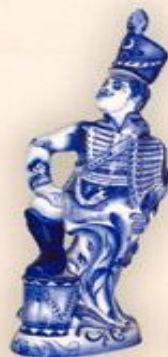
Штоф "Гусар" (1,0 л.)