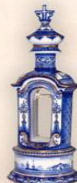
Штоф "Колокольня", (1,2 л.)