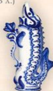
Штоф "Осетр" (1,0 л.)