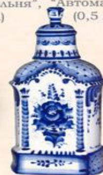
Штоф "Часовня" (0,5 л.)