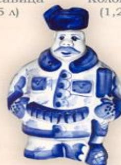
Штоф "Егерь" (0,5 л.)