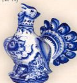
Штоф "Глухарь" (2,0 л.)