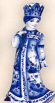
Штоф "Русская красавица" (0,75 л.)