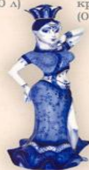
Штоф "Танцовщица" (1,2 л.)