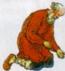
Иллюстрация худ. Е. Пашкова

Говорит старику старуха: «Воротись, поклонися рыбке. Не хочу быть вольною царицей, Хочу быть владычицей морскою, Чтобы жить мне в Окияне-море, Чтоб служила мне рыбка золотая И была б у меня на посылках».