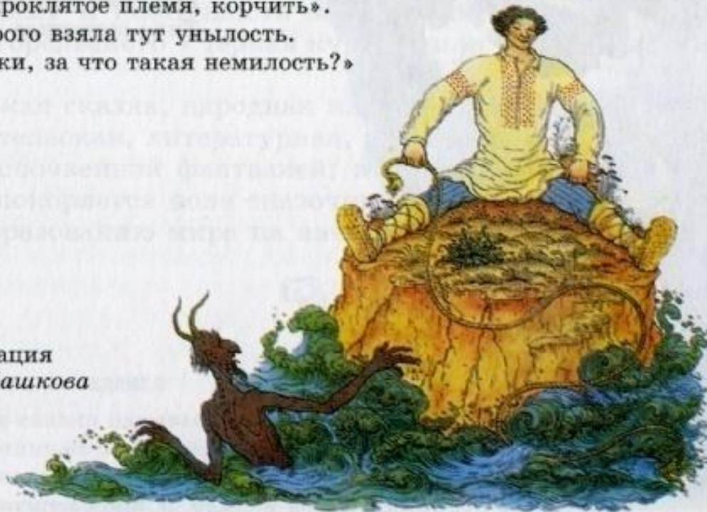
Иллюстрация худ. Е. Пашкова

Вот из моря вылез старый Бес: «Зачем ты, Балда, к нам залез?» — «Да вот веревкой хочу море морщить, Да вас, проклятое племя, корчить». Беса старого взяла тут унылость. — «Скажи, за что такая немилость?»