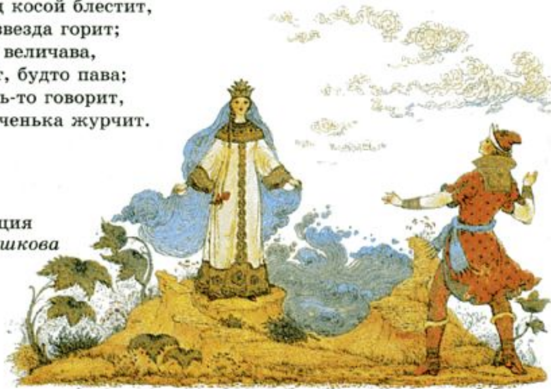
Иллюстрация худ. Е. Пашкова

Месяц под косою блестит, А во лбу звезда горит; А сама-то величава, Выступает, будто пава; А как речь-то говорит, Словно реченька журчит.