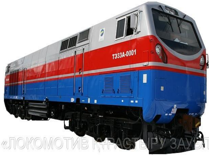
«ЛОКОМОТИВ ҚҰРАСТЫРУ ЗАУАТЫ»