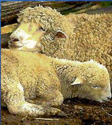
Овца с ягнёнком