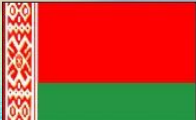
Государственный флаг Беларуси