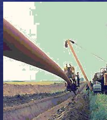
Газопровод магистральный (укладывание в траншею).