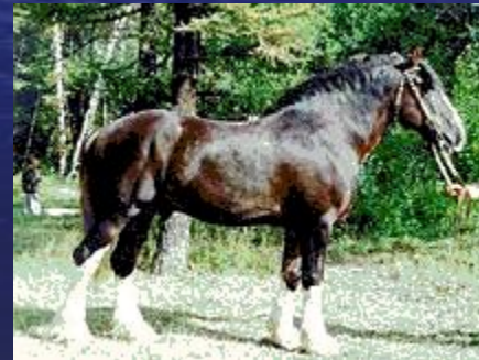
Беларуский тяжёлоупряжный кинь