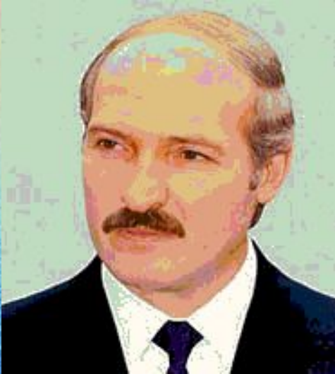
Президент Беларуси Александр Лукашенко 2000-й год