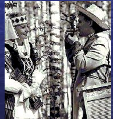
Население Беларуси в национальных костюмах