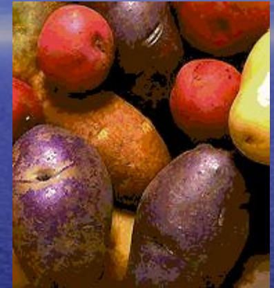
Разные сорта картофеля