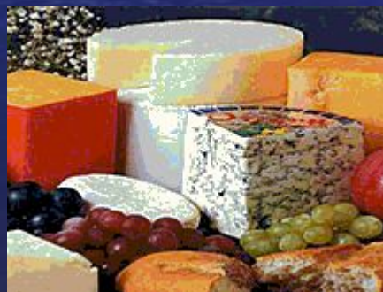
Разные сорта сыра