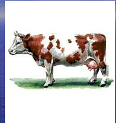
Корова симентальской породы