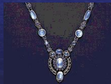
Подвеска с кулоном