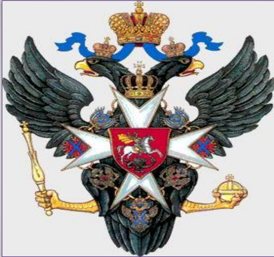
Герб при Павле I (1796-1801)