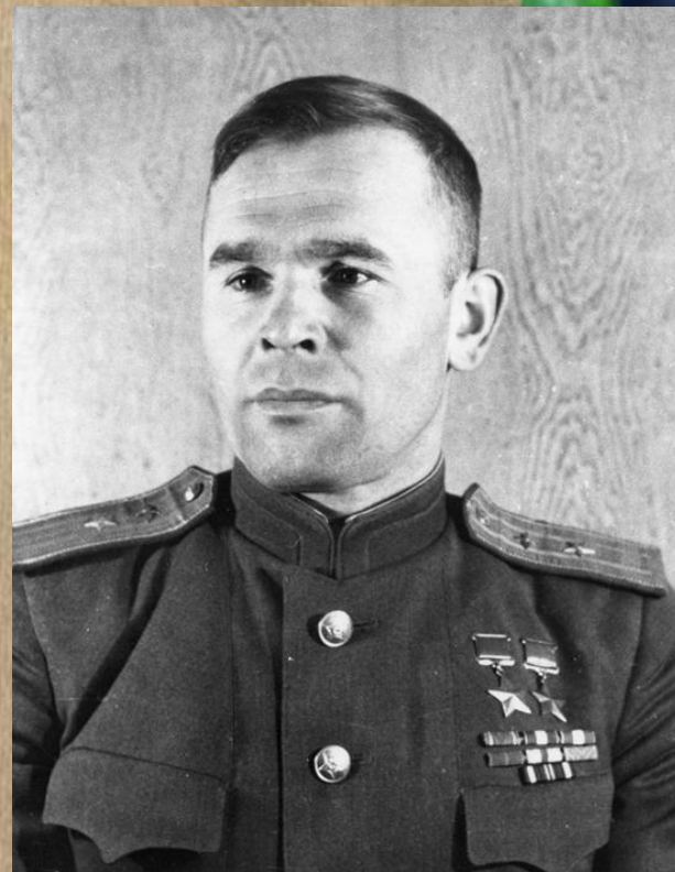
Арсений Васильевич Ворожейкин

И вообще, если люди забывают минувшую войну, то эта забывчивость порождает новую».