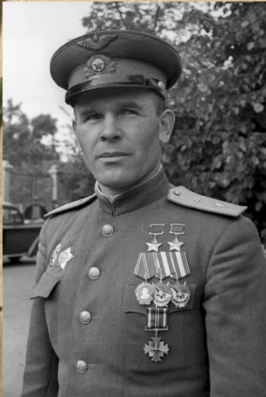
Ворожейкин Арсений Васильевич

А.В.Ворожейкин награждён орденом Ленина, четырьмя орденами Красного Знамени, орденом Суворова 3-й степени, орденами Александра Невского, Отечественной войны 1-й степени, двумя орденами Красной Звезды, иностранными орденами, в том числе двумя орденами Монголии и Высшим Крестом за авиационные боевые заслуги Америки, всего 29 орденов, и многочисленными медалями.