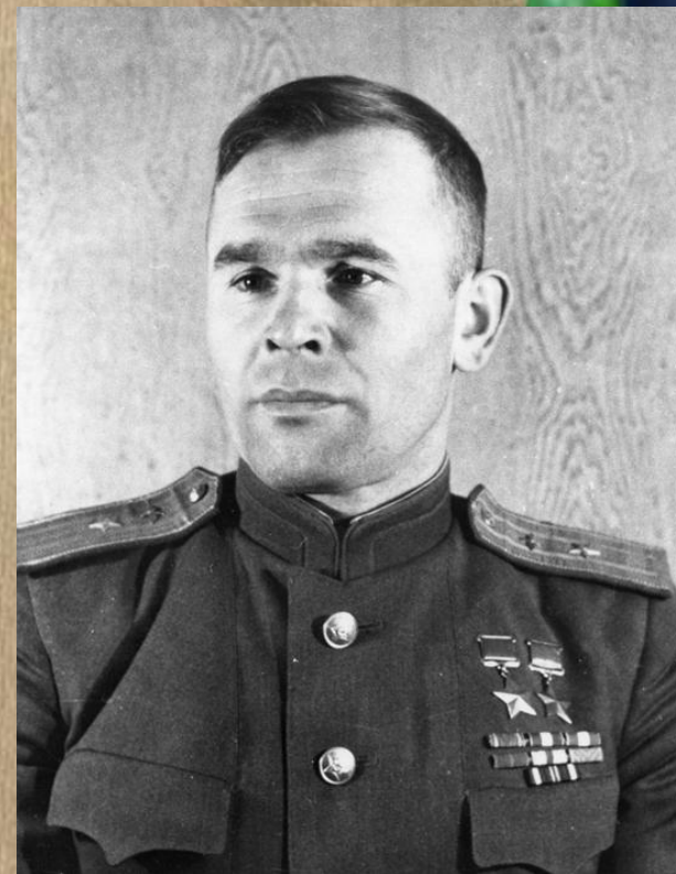
Арсений Васильевич Ворожейкин

И вообще, если люди забывают минувшую войну, то эта забывчивость порождает новую».