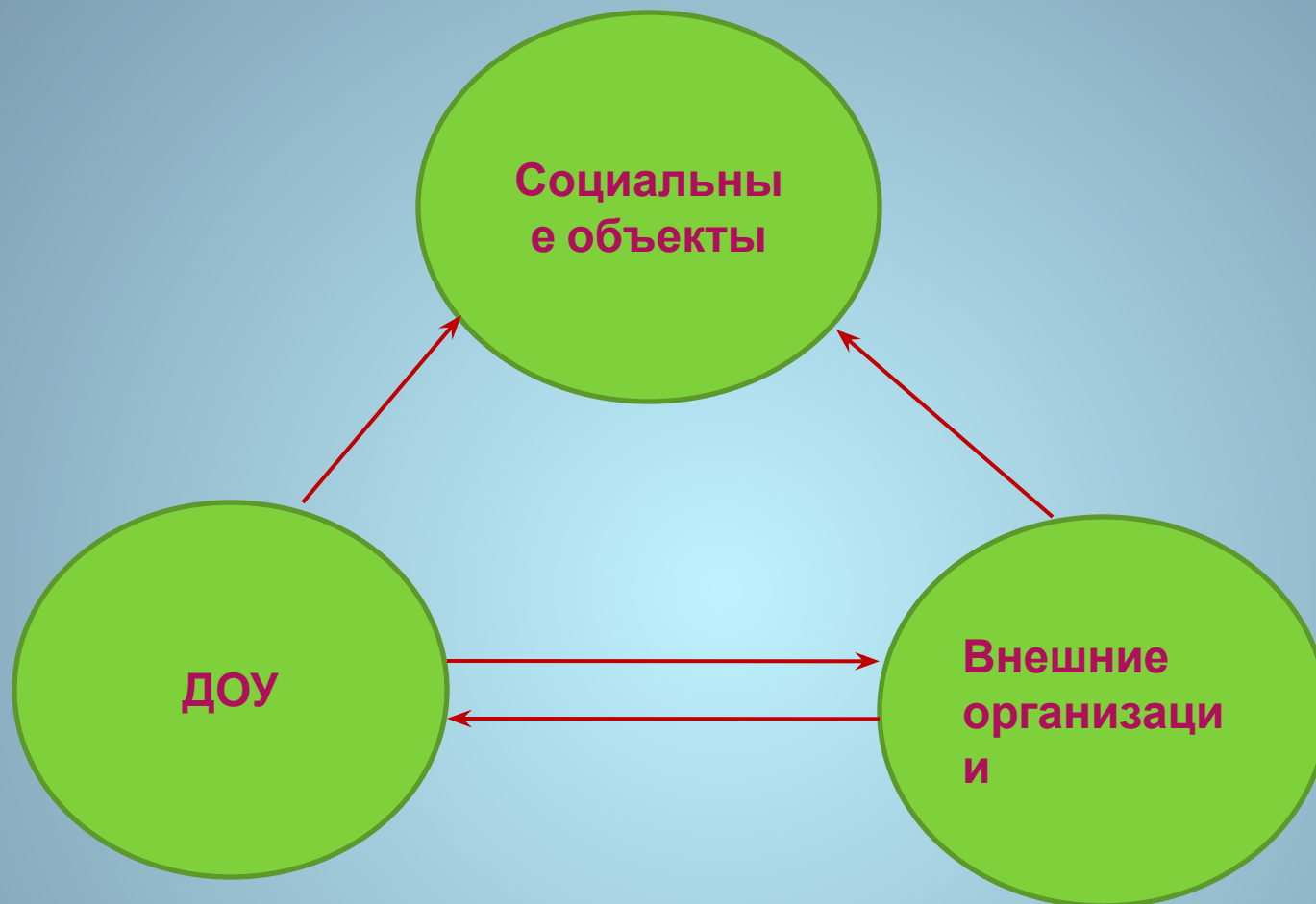
Схема взаимодействия в 2014-15г.г.