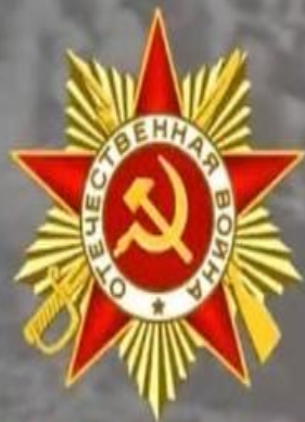
Орден Великой Отечественной войны 1 степени