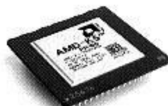
5k86 (166 МГц)