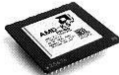
5k86 (166 МГц)