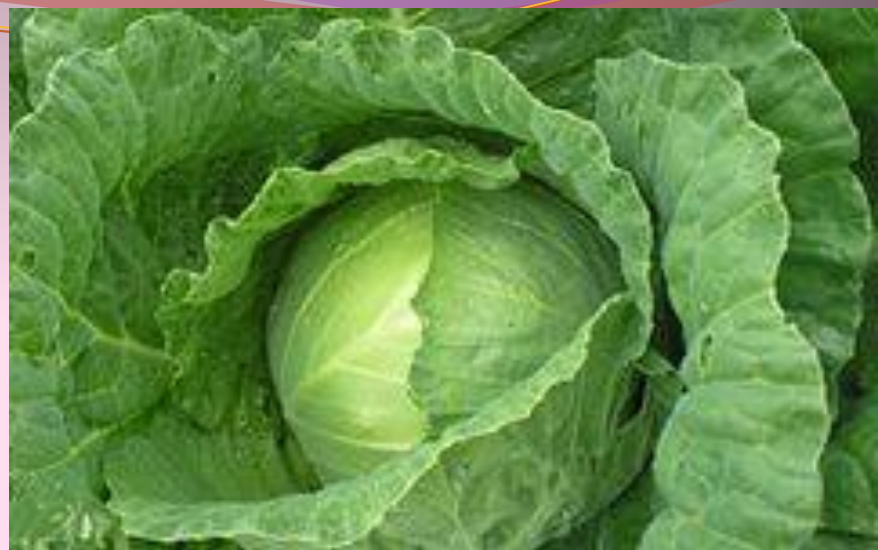
Капуста - капста