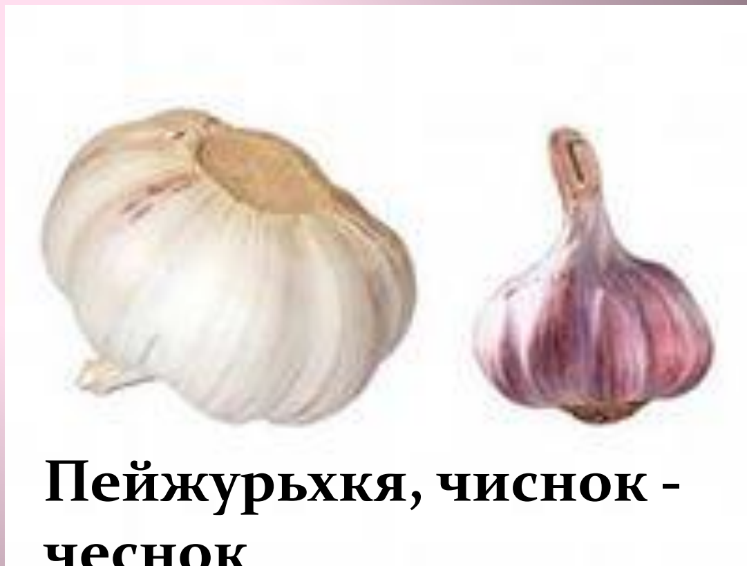
Пейжурьхкя, чеснок - чеснок