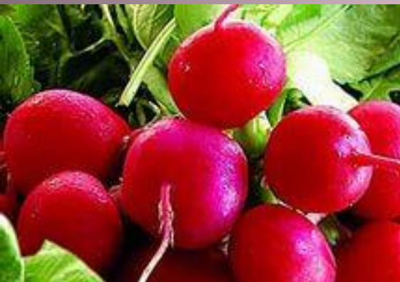
Редиска - редис