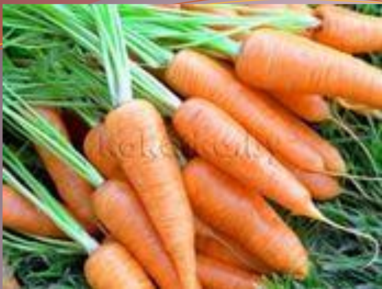
Морковь - пурька