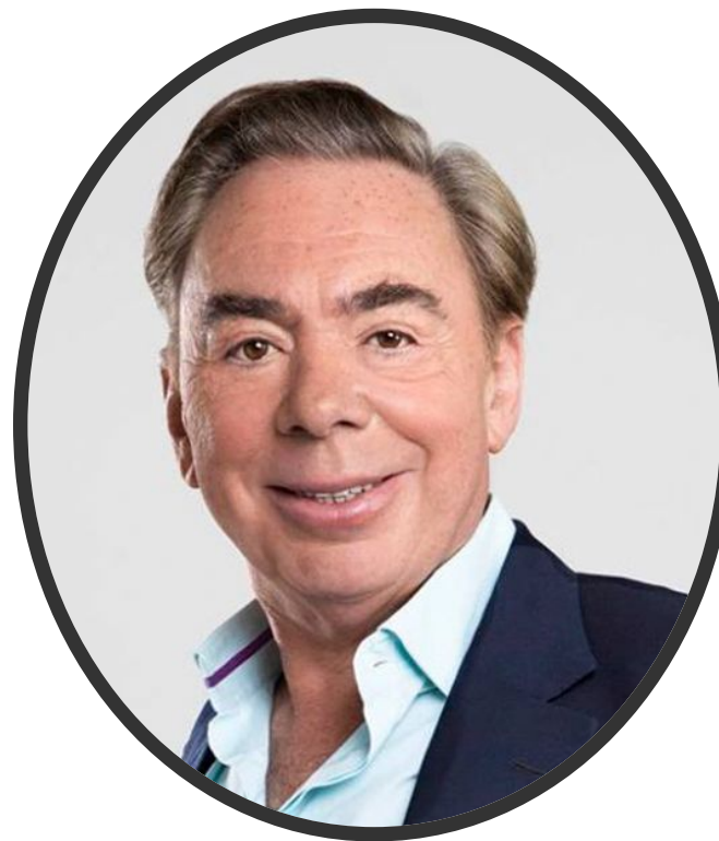
Эндрю Ллойд Уэббер