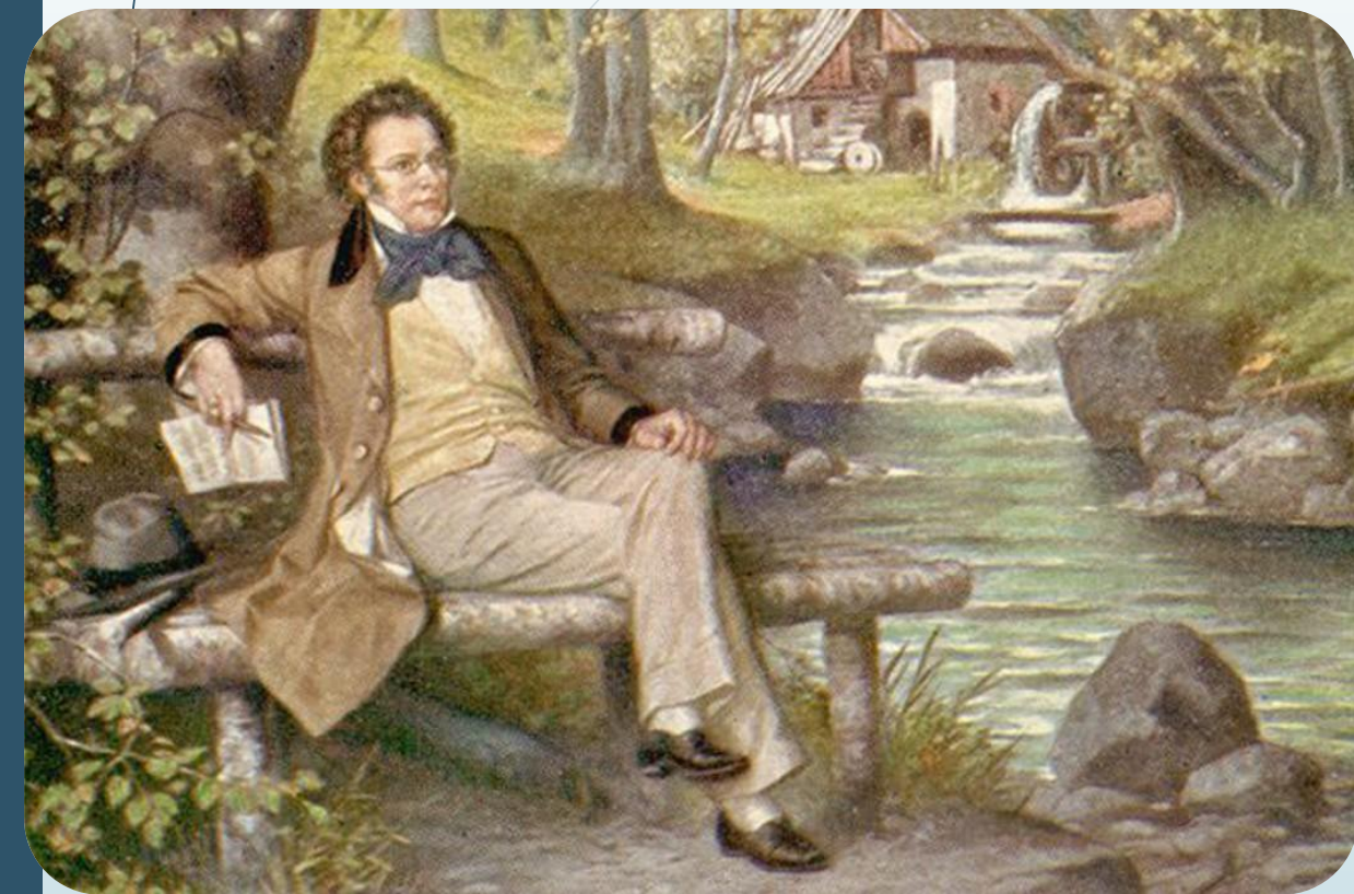
Франц Шуберт (1797-1828)