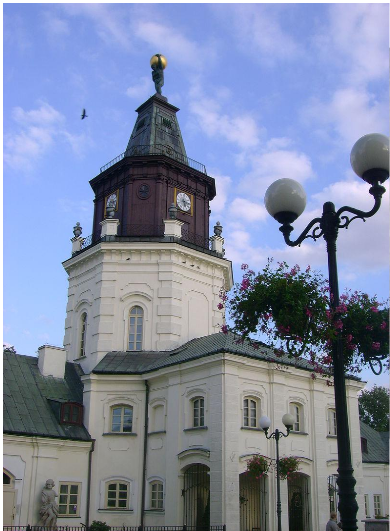
г. Седльце, Польша