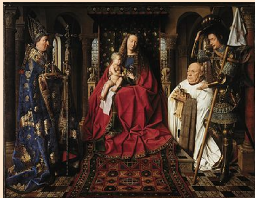
“Мадонна каноника ван дер Пале”