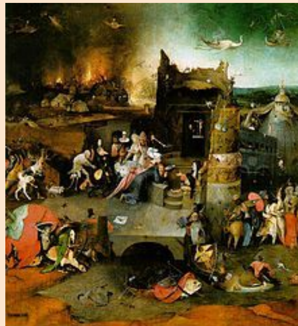
Часть триптиха “Искушение святого Антония”