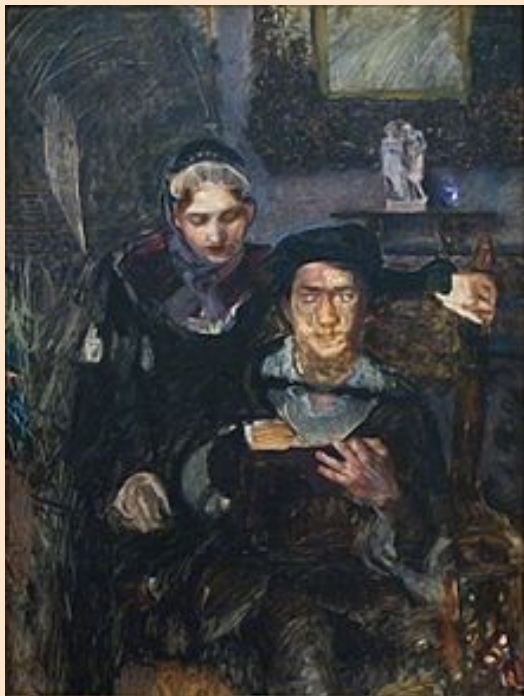
Михаил Врубель. «Гамлет и Офелия», 1884