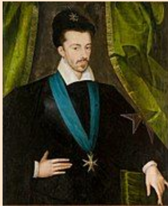
“Этьен Дюмустье. Портрет Генриха III Валуа”