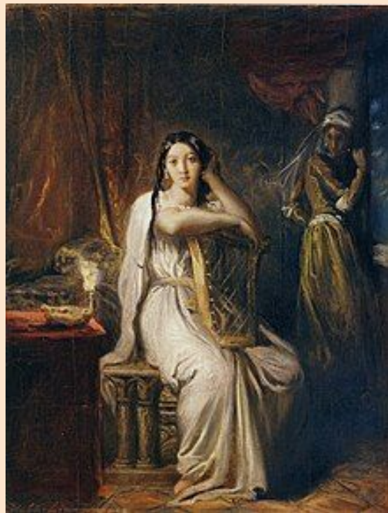
Теодор Шассерио «Дездемона», XIX век