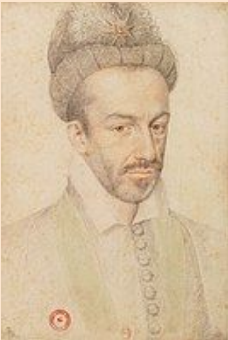
“Этьен Дюмустье. Портрет Генриха III”