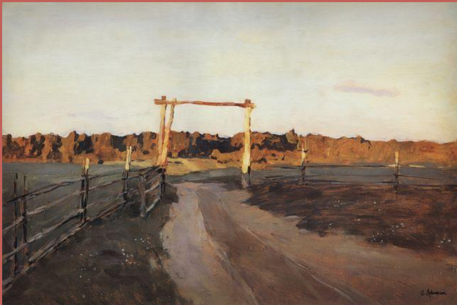
И.И. Левитан «Золотая осень»