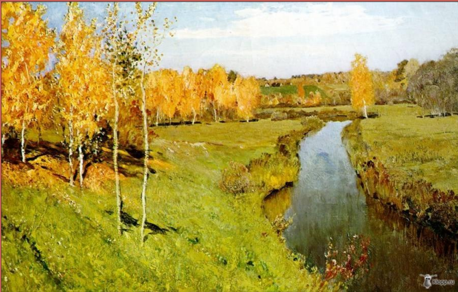
И.И. Левитан «Золотая осень» (1895)