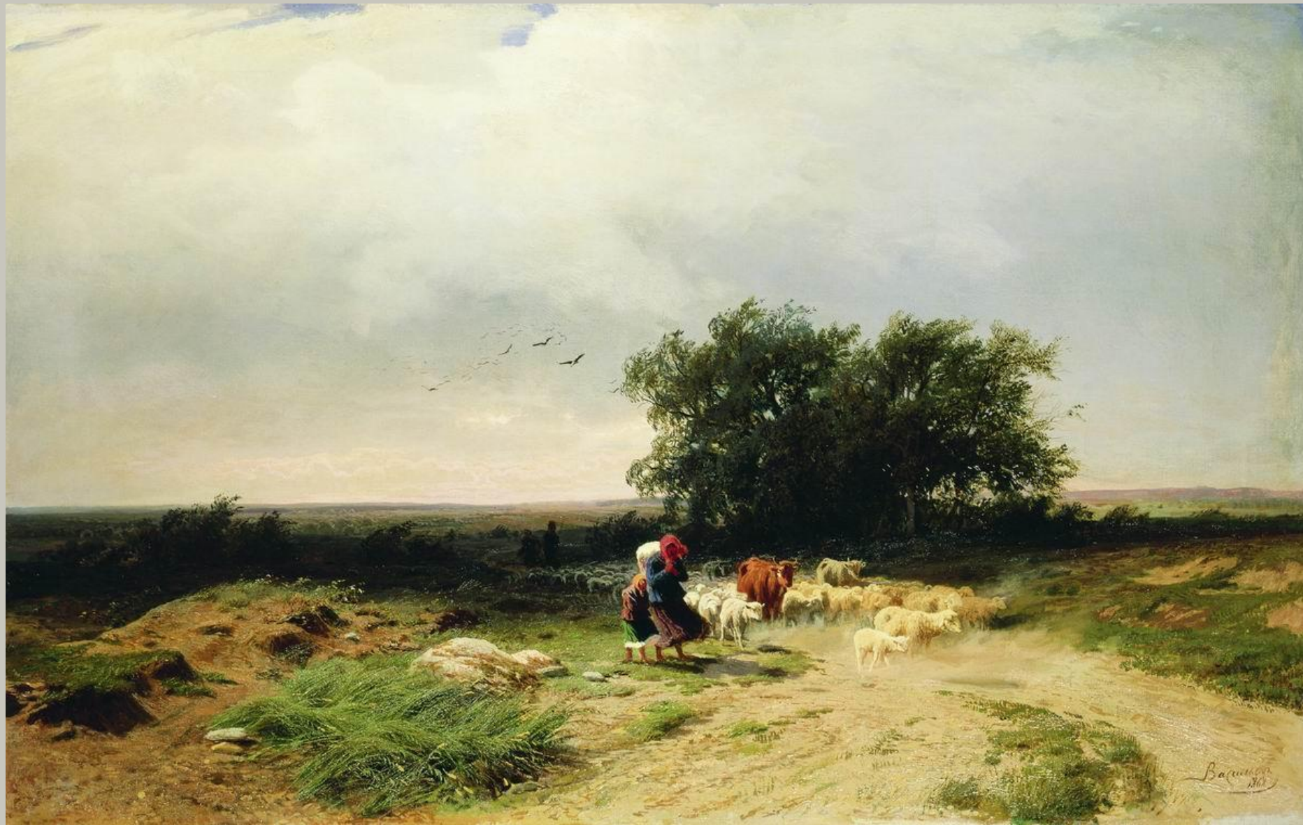
Васильев Фёдор Александрович «Приближение грозы»