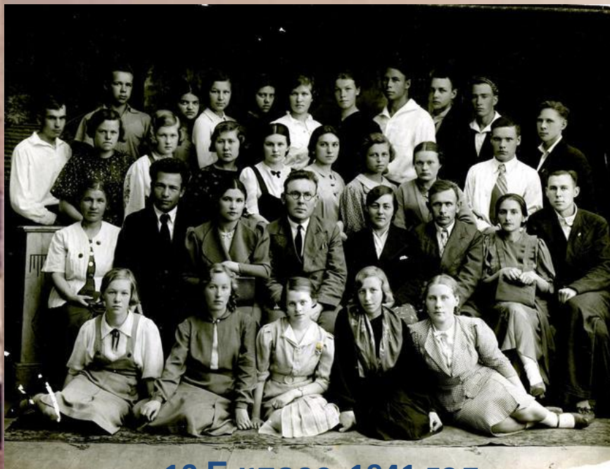
10 Б класс, 1941 год Школа №30 г. Ижевска