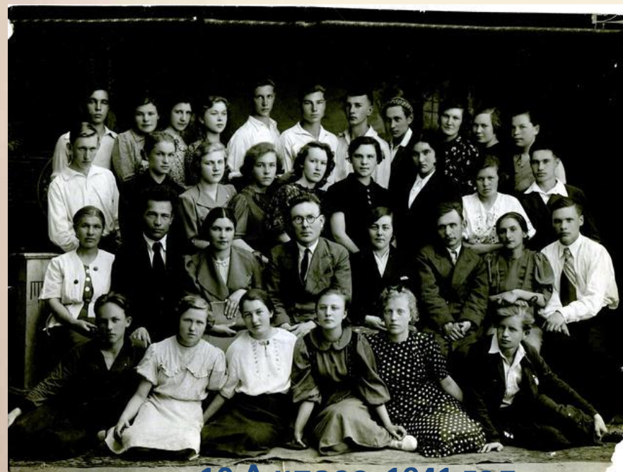
10 А класс, 1941 год Школа №30 г. Ижевска