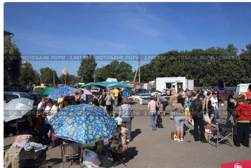
Псков. Центральный рынок