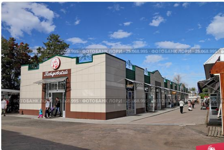
Псков. Торговый ряд "Петровский" Центрального рынка