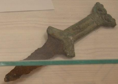
Нож бронзового века Бронза быуат бысағы