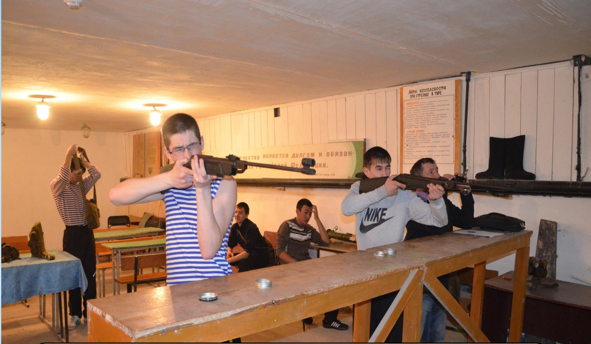
Участие в зональном конкурсе призывников в с. Дуван