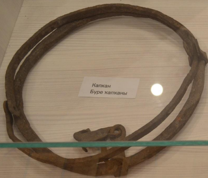
Капкан Буре капканы