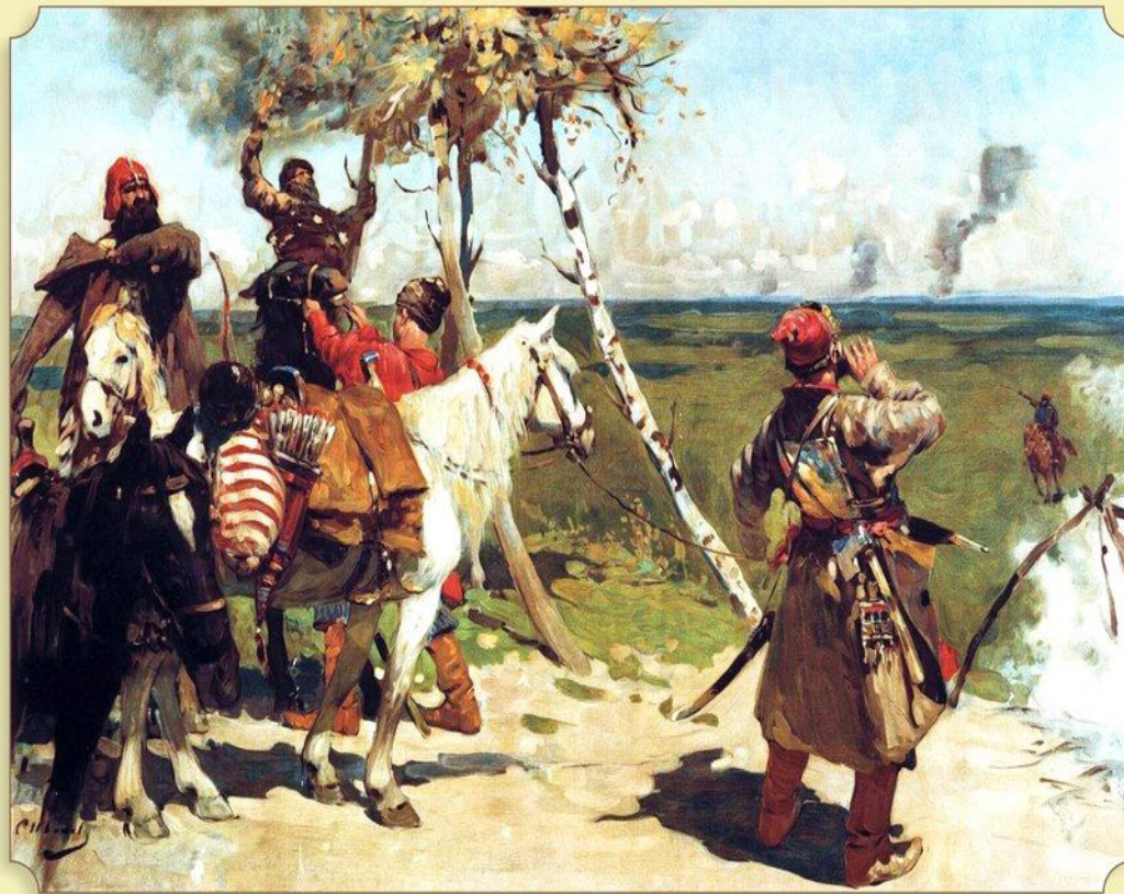
Иванов С.В. На сторожевой границе Московского государства. Холст, масло. 1907 г.

Во второй половине 17 века от Днепра до Урала через все Дикое поле протянулась цепочка новых засечных черт (засечная черта - линии оборонительных сооружений. Строившиеся для защиты южных и юго-восточных границ). Вдоль них выросли русские крепости Тамбов (1636), Пенза (1663), Симбирск (1648) - сейчас это город Ульяновск. Под их охраной степи Черноземья и Нижней Волги стали распахиваться и заселяться русскими, украинцами, мордовскими и татарскими земледельцами. За линиями укрепления земли осваивали казаки. После Смуты жители Донских станиц стали ежегодно получать жалование из Москвы хлебом, порохом, свинцом. За все это казаки должны были охранять границы России и приносить присягу на верность царю.