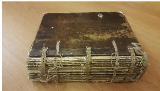
Архангельское Евангелие 1092 года