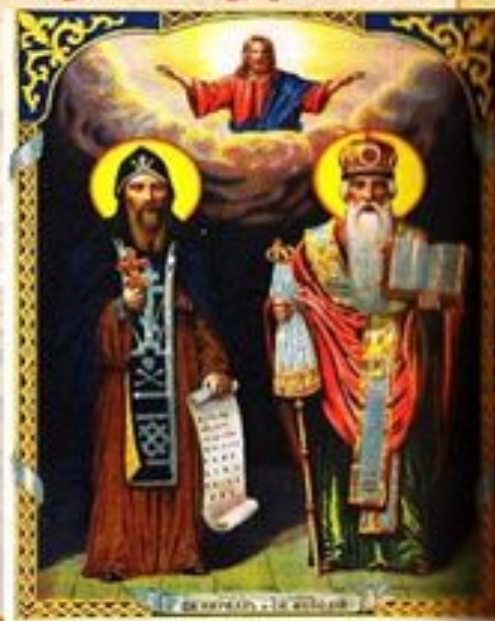
Братья из Славян Кирилл и Мефодий, созданы как первые известные создатели славянской азбуки. Хронографическая. 1914 г.