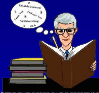
Предоставление санитарно-просветительных брошюр