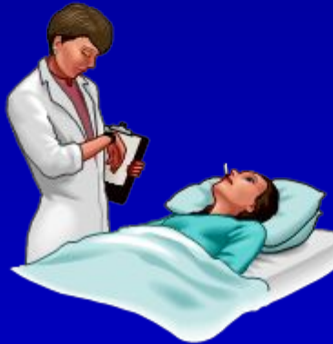
Посещения на дому, выписывание рецептов (Великобритания)