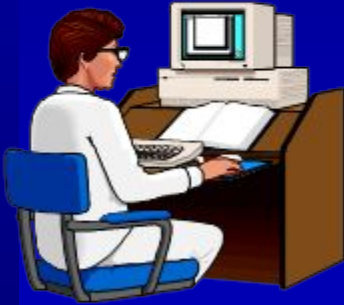
Регистрация пациентов (Нидерланды)