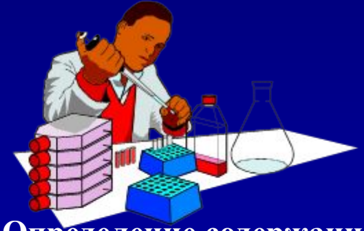
Определение содержание холестерина и глюкозы в крови