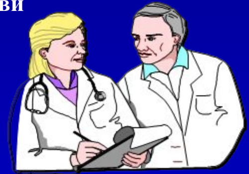
Предоставление информации по лечению недугов и применению ОТС-препаратов