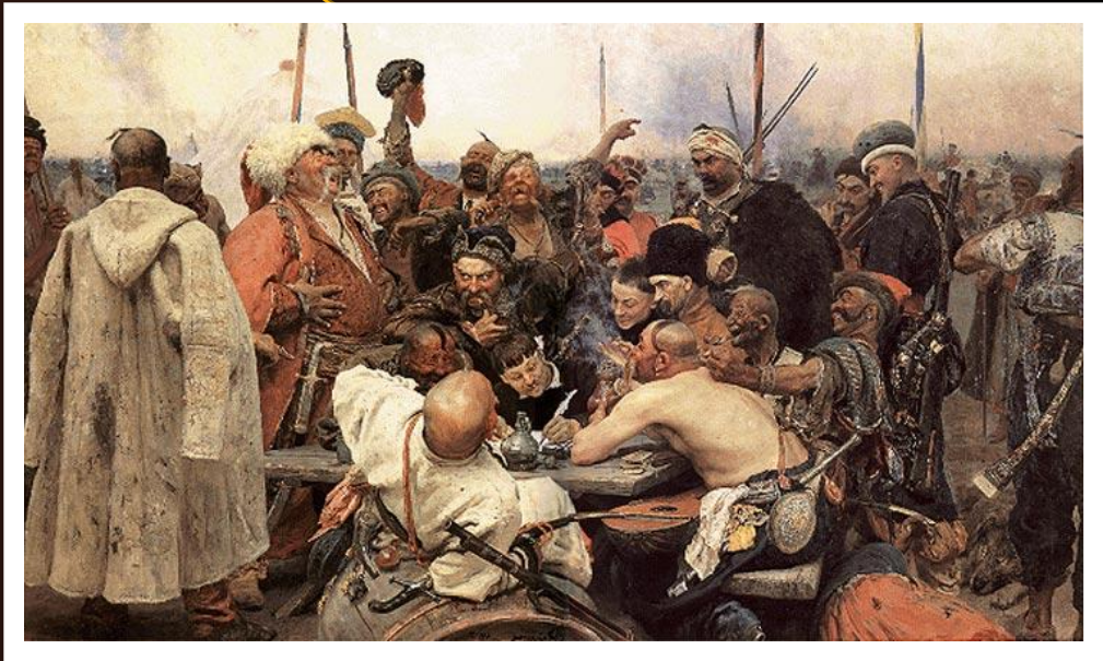
Репин «Запорожцы пишут письмо турецкому султану»