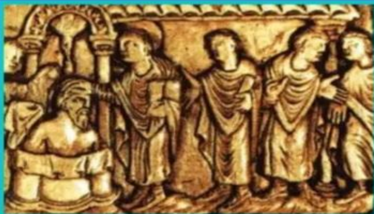
Крещение Хлодвига. Древний барельеф.

Хлодвиг был умным политиком, -он понимал, что одной силы мало для того, чтобы держать население в покорности.