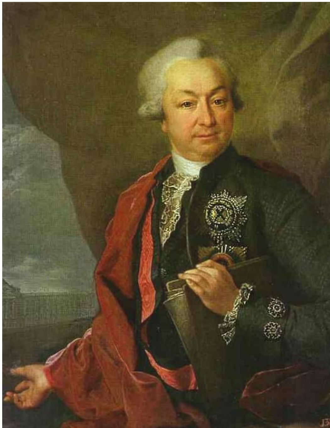
Д.Левицкий Портрет И.И.Шувалова

Разработанный М.В. Ломоносовым проект взял под своё попечение граф Иван Иванович Шувалов, человек образованный и культурный.