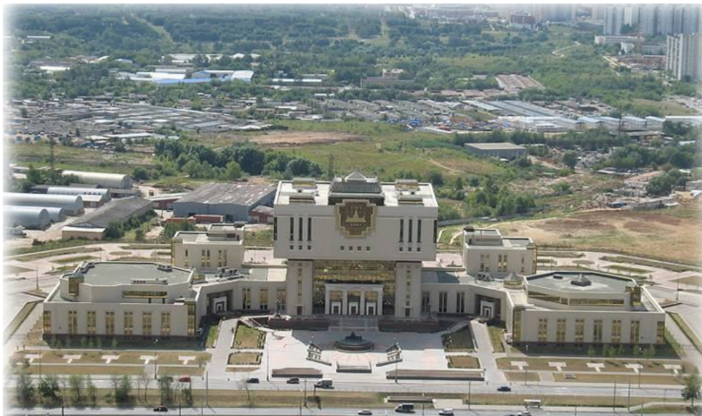
Библиотека Московского государственного университета