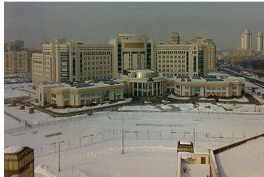
Первый учебный корпус