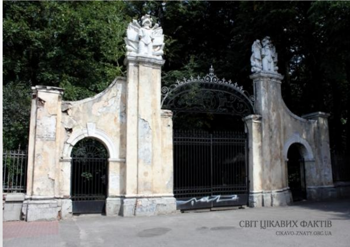
Замок Потоцьких в Івано-Франківську