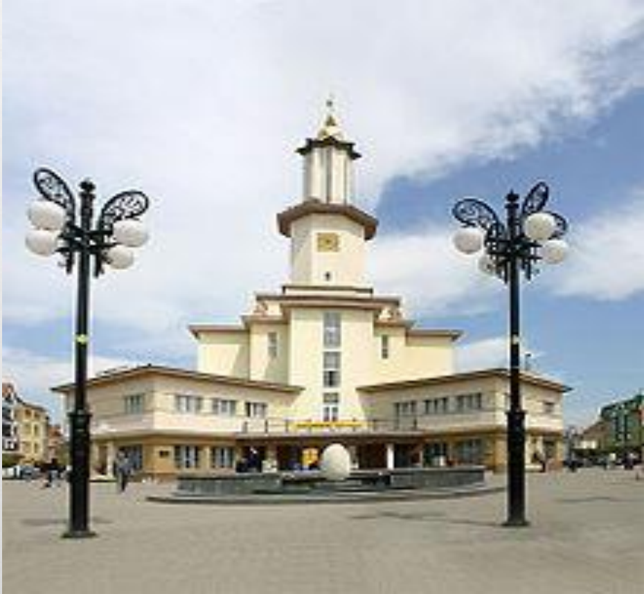
Ратуша в Івано-Франківську