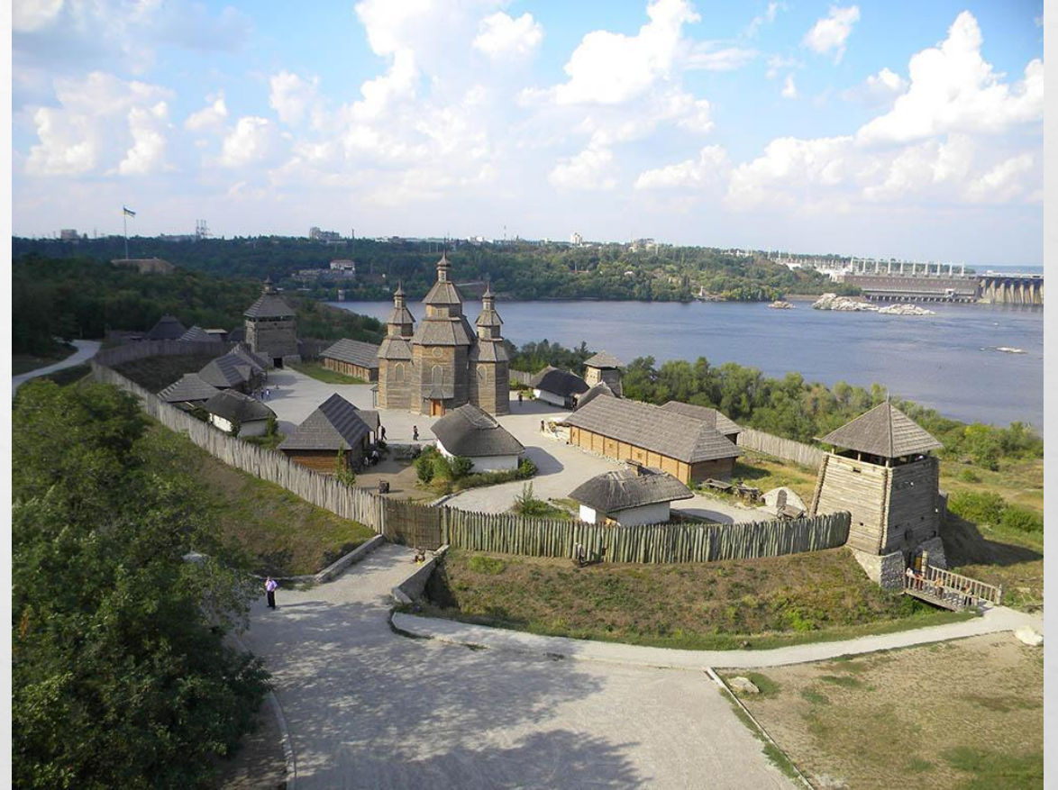
Національний заповідник "Хортиця"