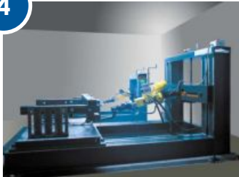
Испытание на специальном оборудовании