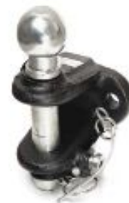
G – Базовый поршневой шар