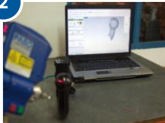
3D дизайн ТСУ