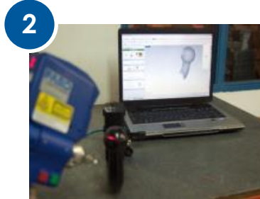
3D дизайн ТСУ