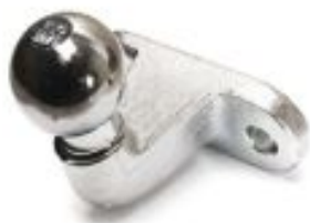
C – Торцевой кованный шар