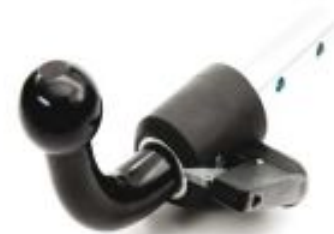
F – Съёмный автоматический горизонтальный шаровой узел