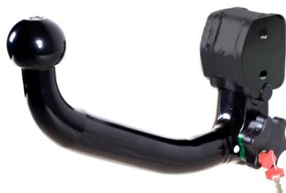
V – Съёмный автоматический вертикальный шаровой узел