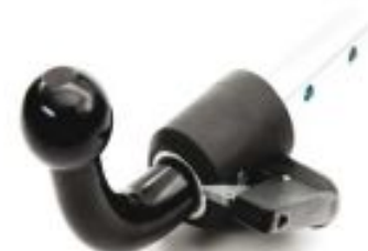
F – Съёмный автоматический горизонтальный шаровой узел