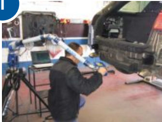
3D сканирование автомобиля