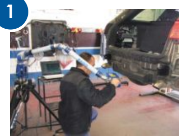
3D сканирование автомобиля