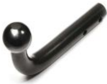
A – Условно-съёмный