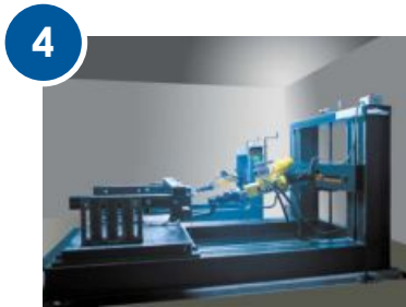
Испытание на специальном оборудовании