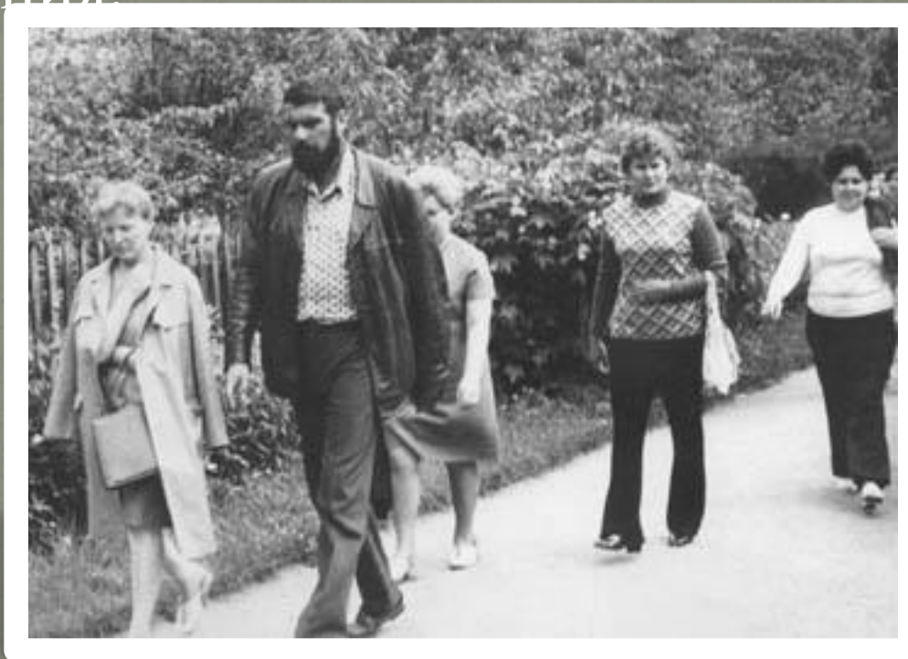
Сергей Довлатов - экскурсовод