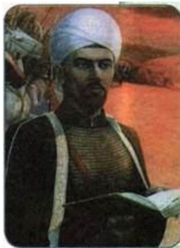
мулла Абдулла Галеев (Батырша)