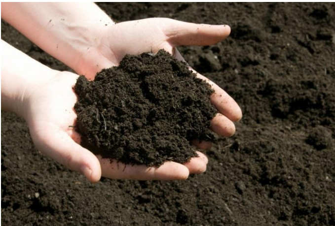
Почва, богатая питательными веществами