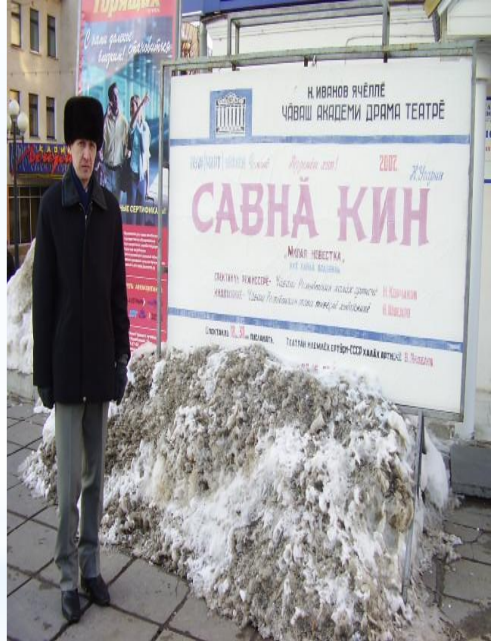
Комедия «Милая невестка» («Савнă кин») – 2007г., Чувашский академический драмтеатр., режиссёр Корчаков Н. В.