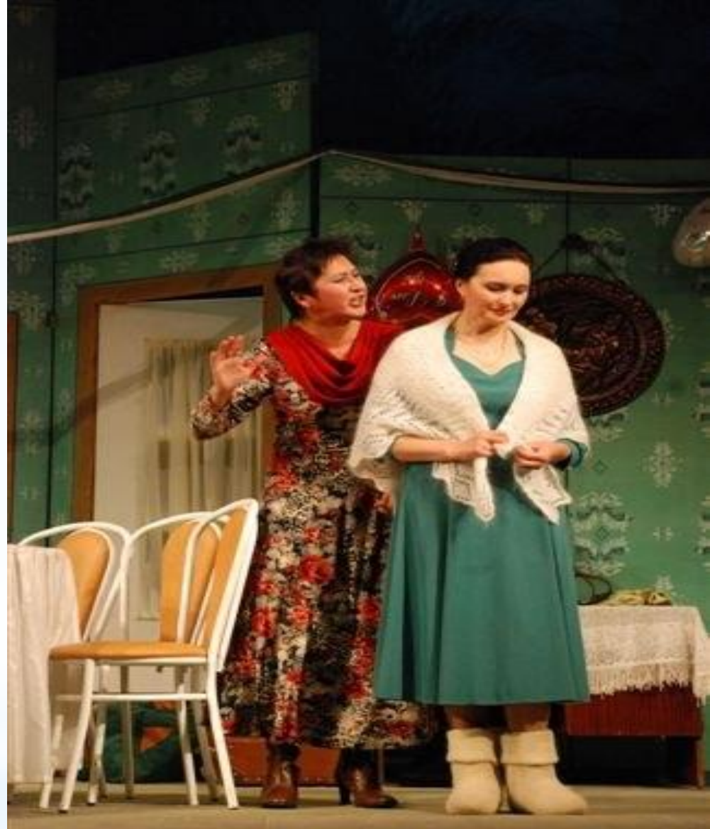
Мелодрама «Свадьба отменяется?» («Туй пулать –и, пулмасть –и?») – 2008 г., Чувашский академический драмтеатр, режиссёр А. Павлов