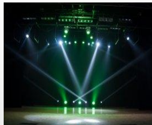
Сцена концертного зала