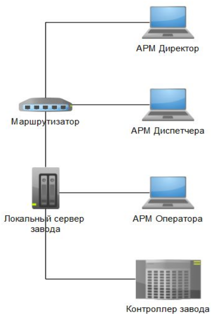
Схема построения АСУ с применением облачного решения

Схема построения локальной АСУ (коробочная версия)