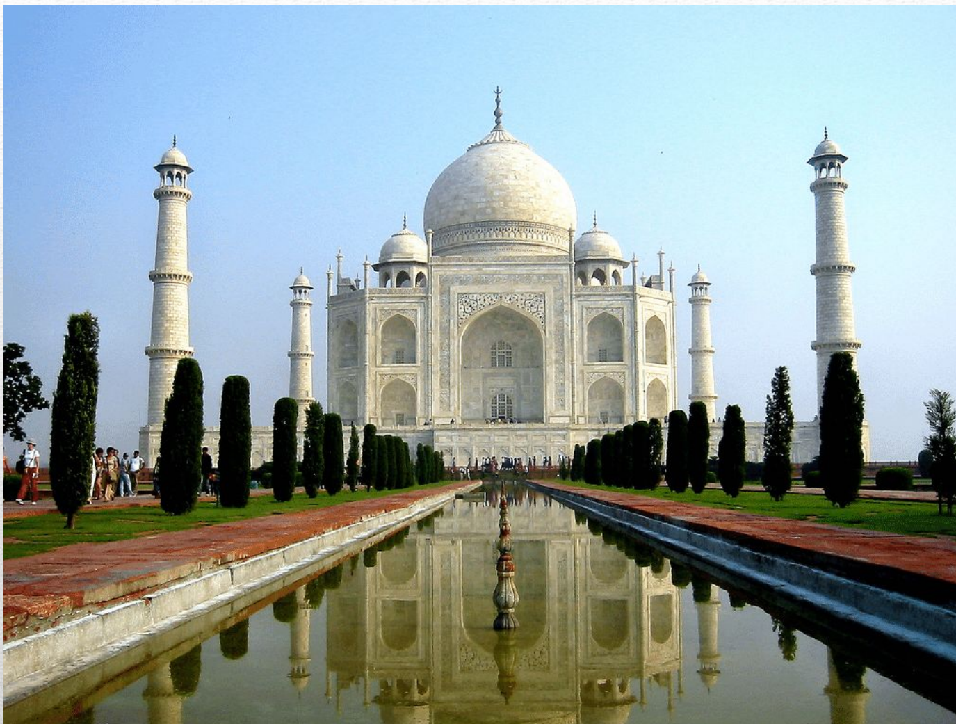
Дворец Тадж- Махал