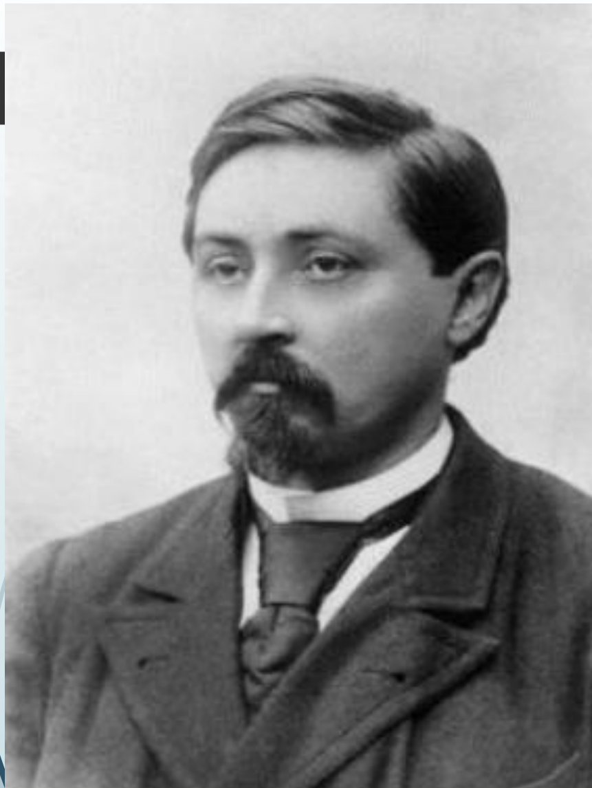
Д. Н. Мамин-Сибиряк 1852-1912