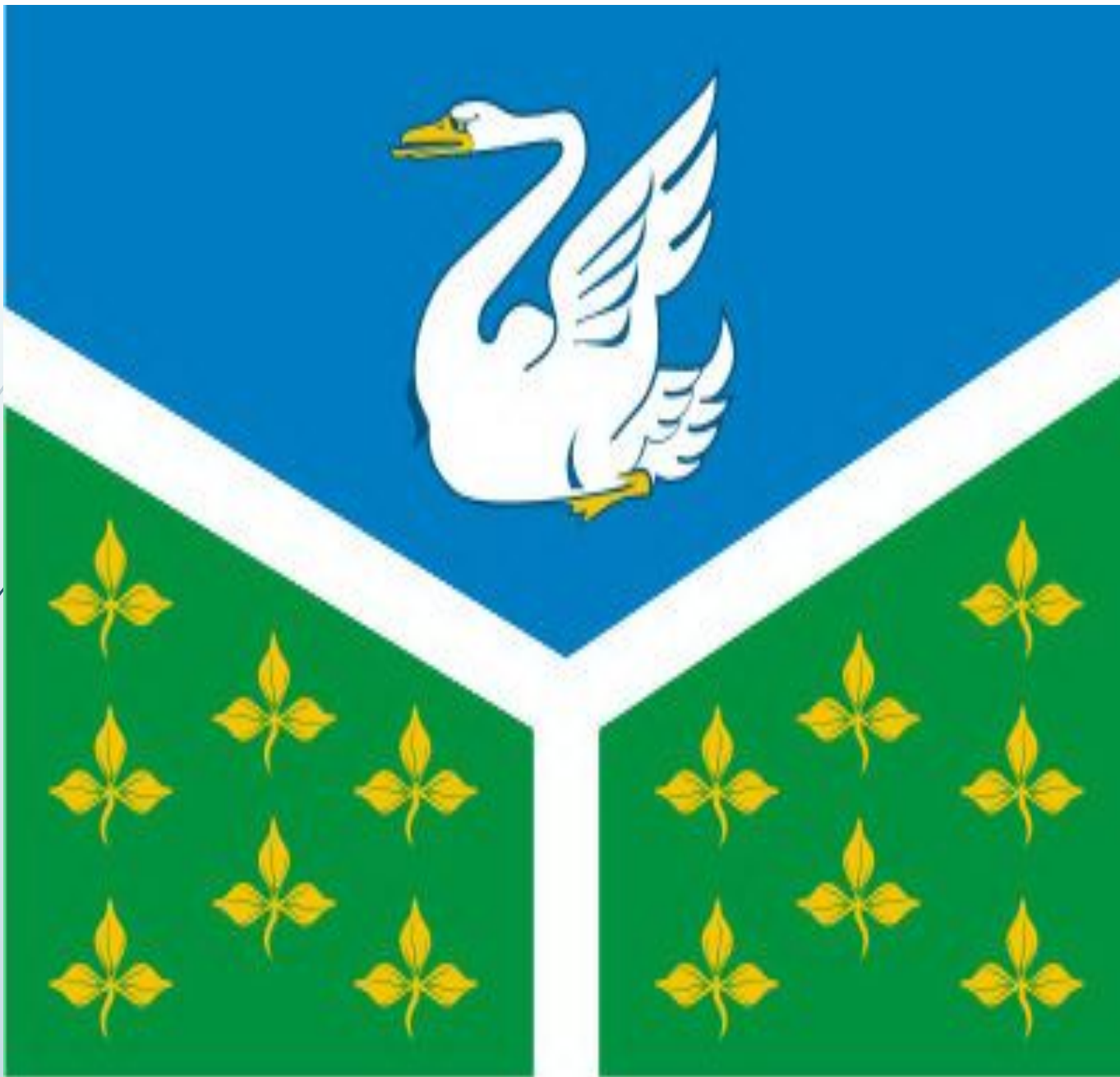
Герб АЧИТСКОГО района