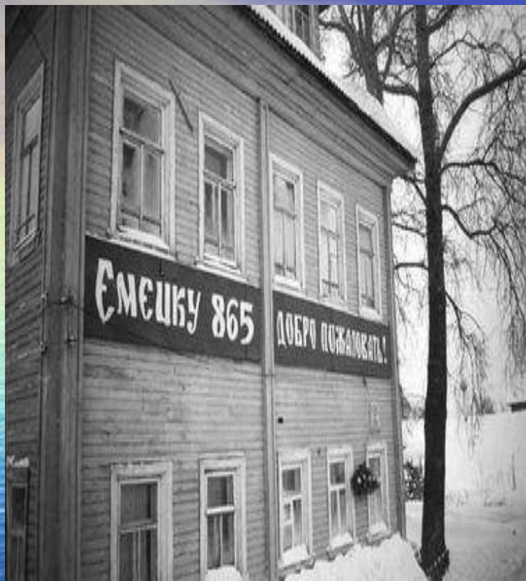
Дом в с. Емецк Архангельской области, где в 1936 г. родился Николай Рубцов

В последние детдомовские годы и годы, проведенные в техникуме, Рубцов словно бы и забыл, что у него есть отец. Никому из его знакомых тех лет не запомнилось, чтобы он пытался восстановить связь с отцом, братом, сестрой, теткой... Быть может, только однажды и попытался рассказать Николай «все накопившееся на душе за эти долгие годы бесконечного молчания». Случилось это уже в 1951 году, когда Рубцов писал сочинение на заданную в техникуме тему: «Мой родной уголок».