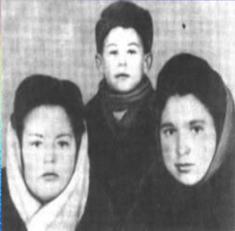
Николай Рубцов с воспитательницами детдома