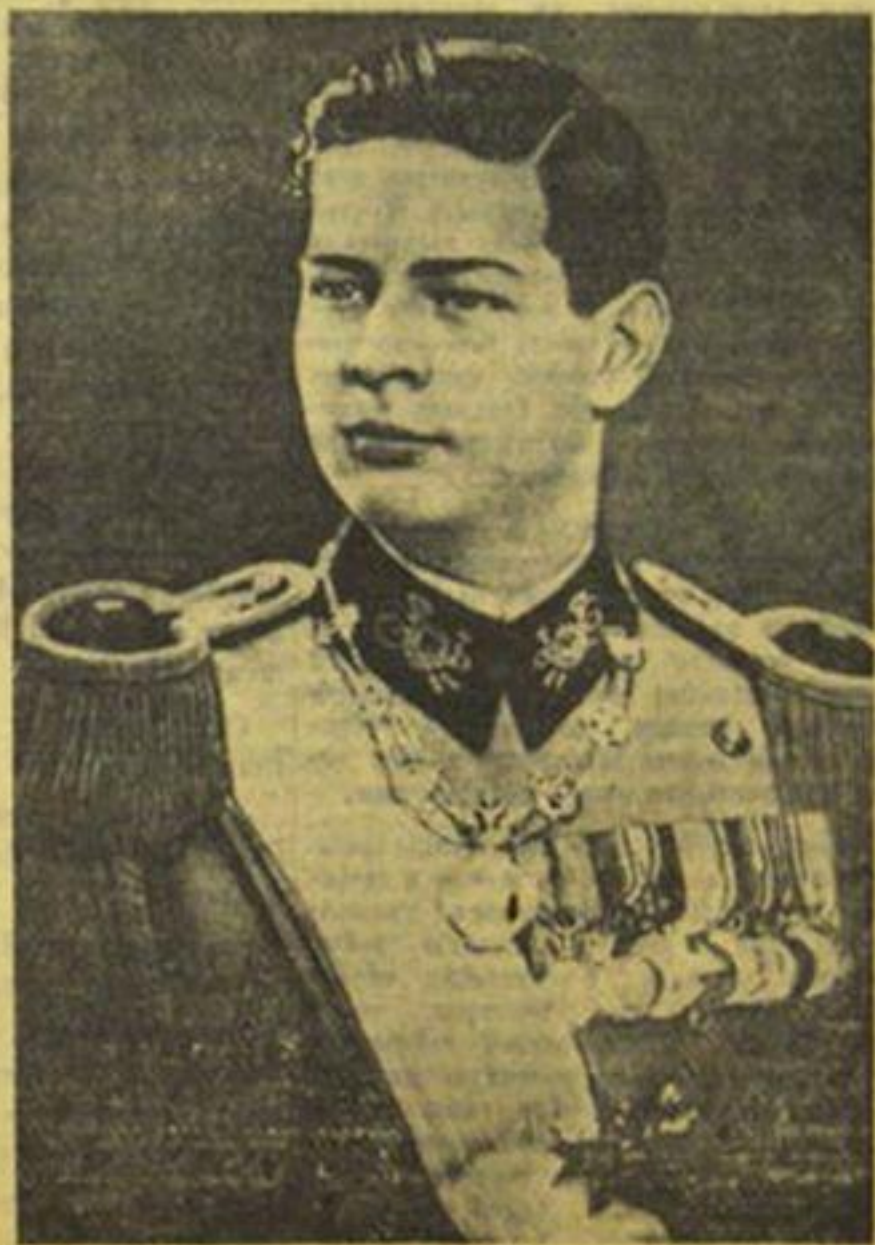
Его Величеству Михай I, Король Румынии.