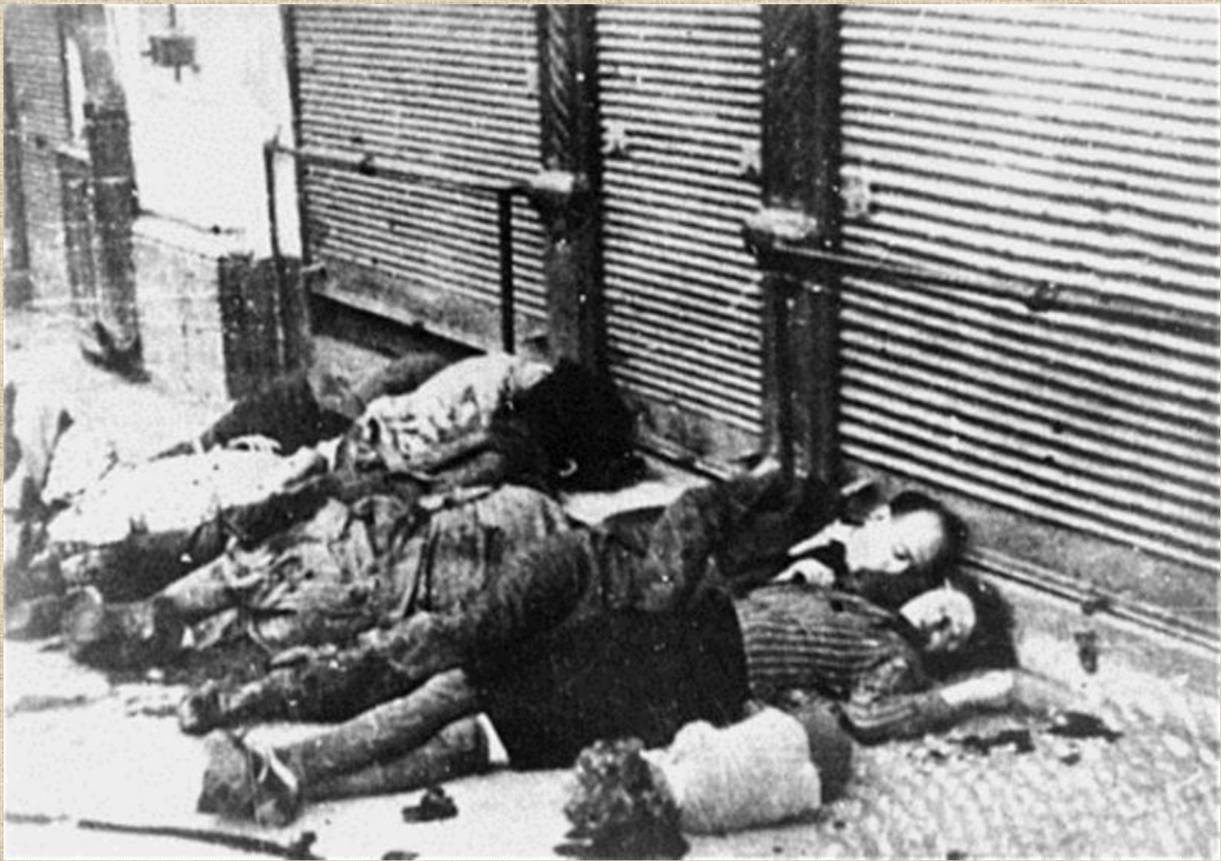
Ясский погром - массовое убийство евреев в румынском городе Яссы, продолжавшееся с 27 июня по 2 июля 1941 г.