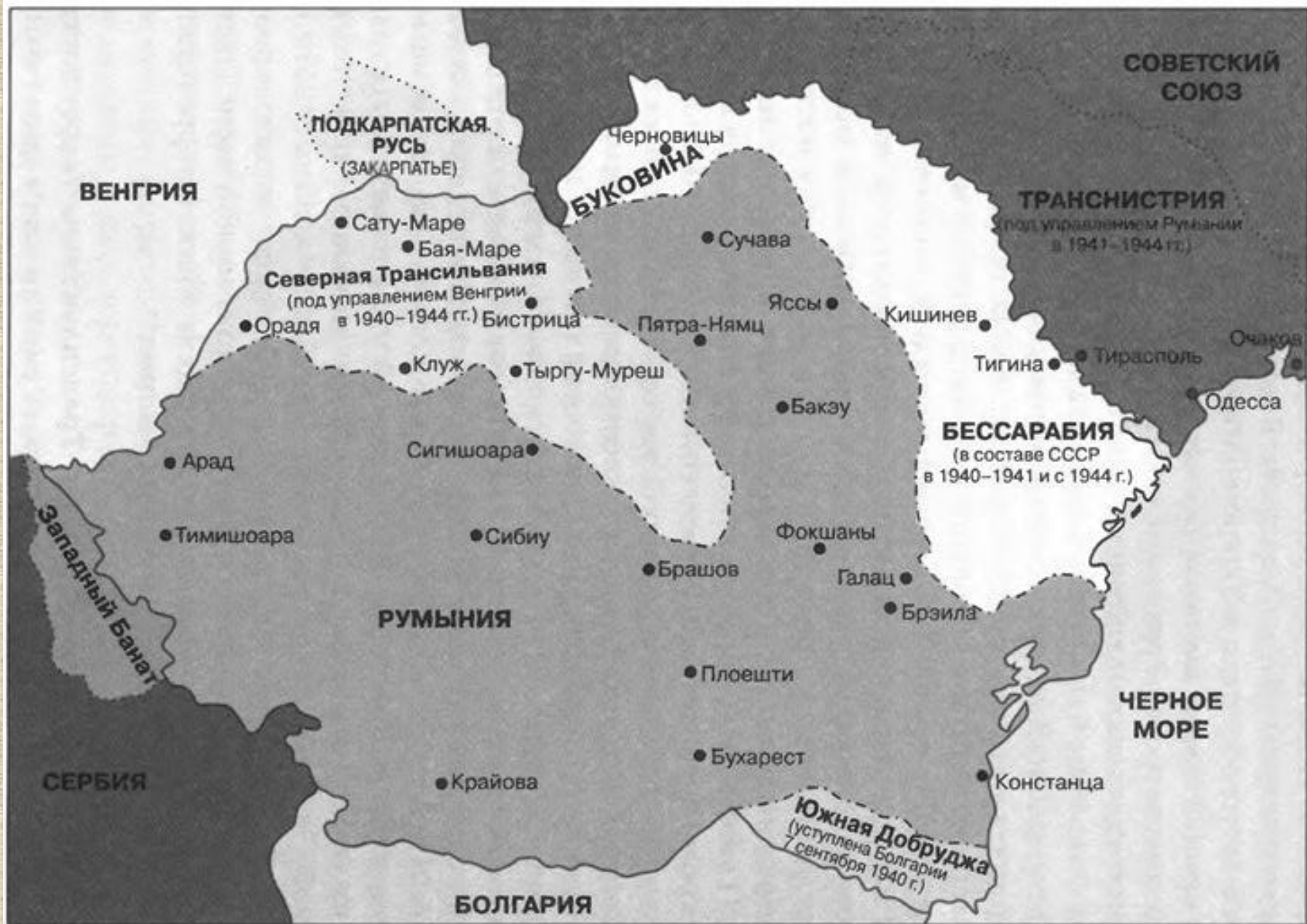
Румыния в годы Второй мировой войны