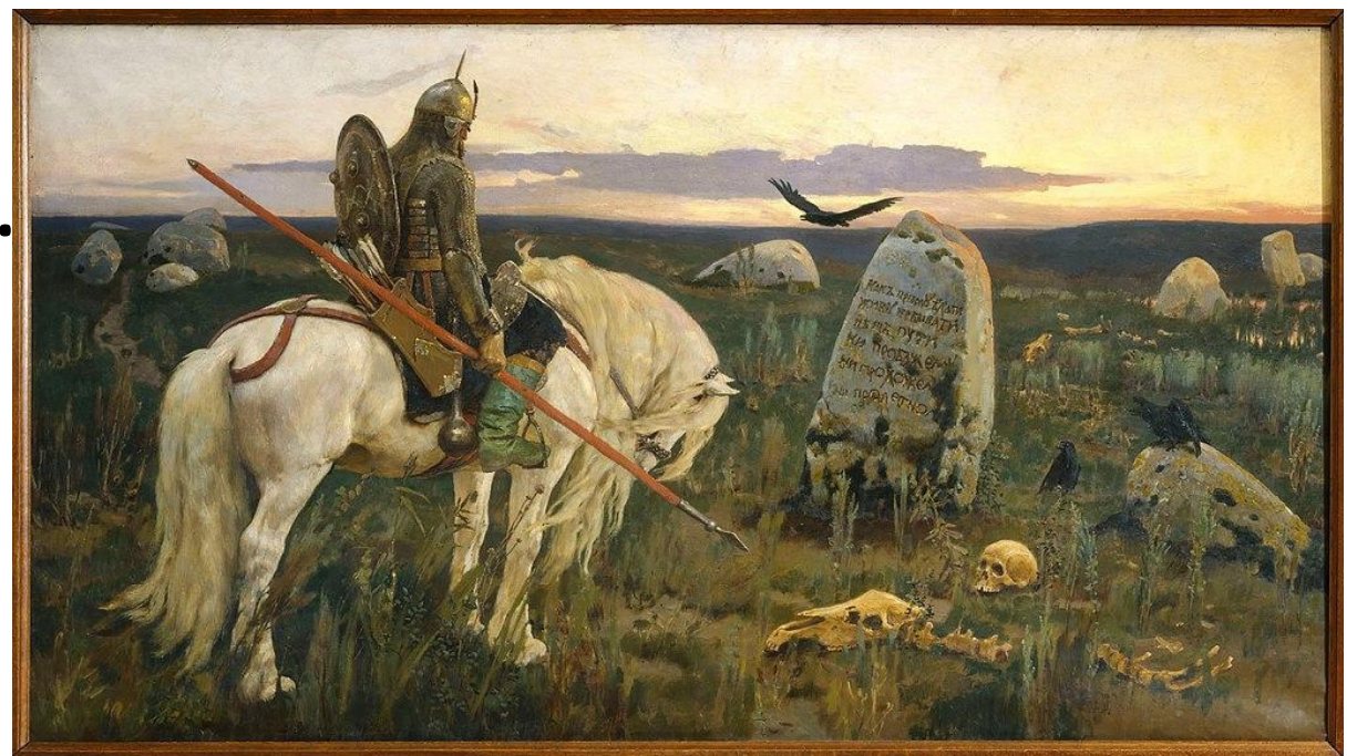
Витязь на пути