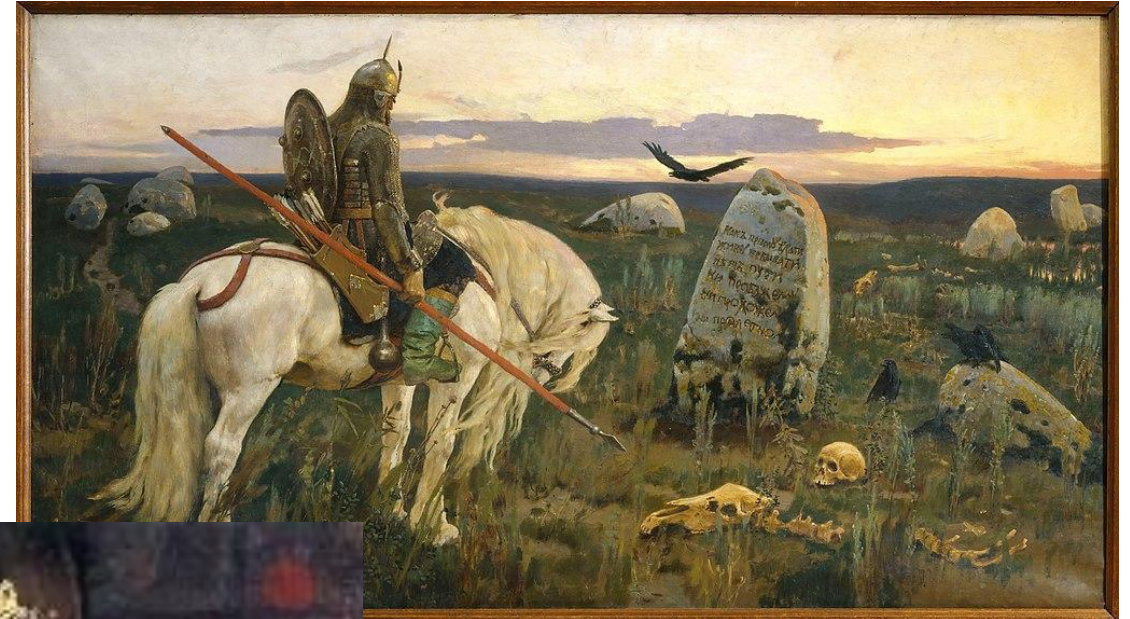
Витязь на распутье