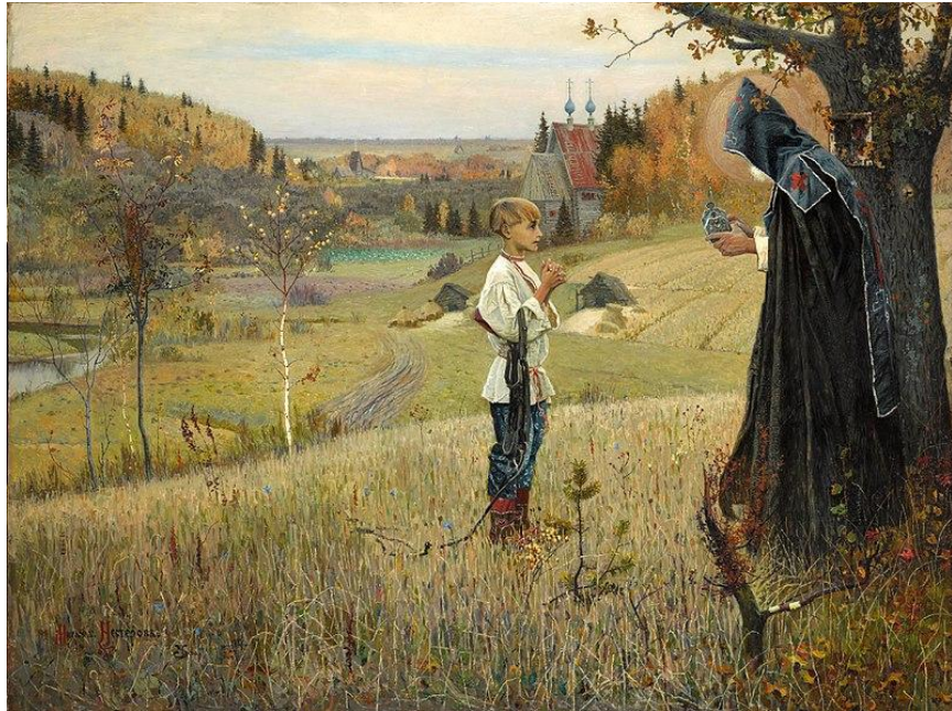
Видение отрока Варфоломея

По описанию определи о какой картине идет речь: после встречи двух происходит чудо. Картина написана на основе «Жития преподобного Сергия»