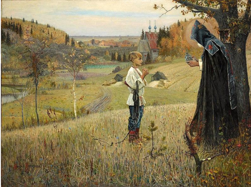
Видение отрока Варфоломея