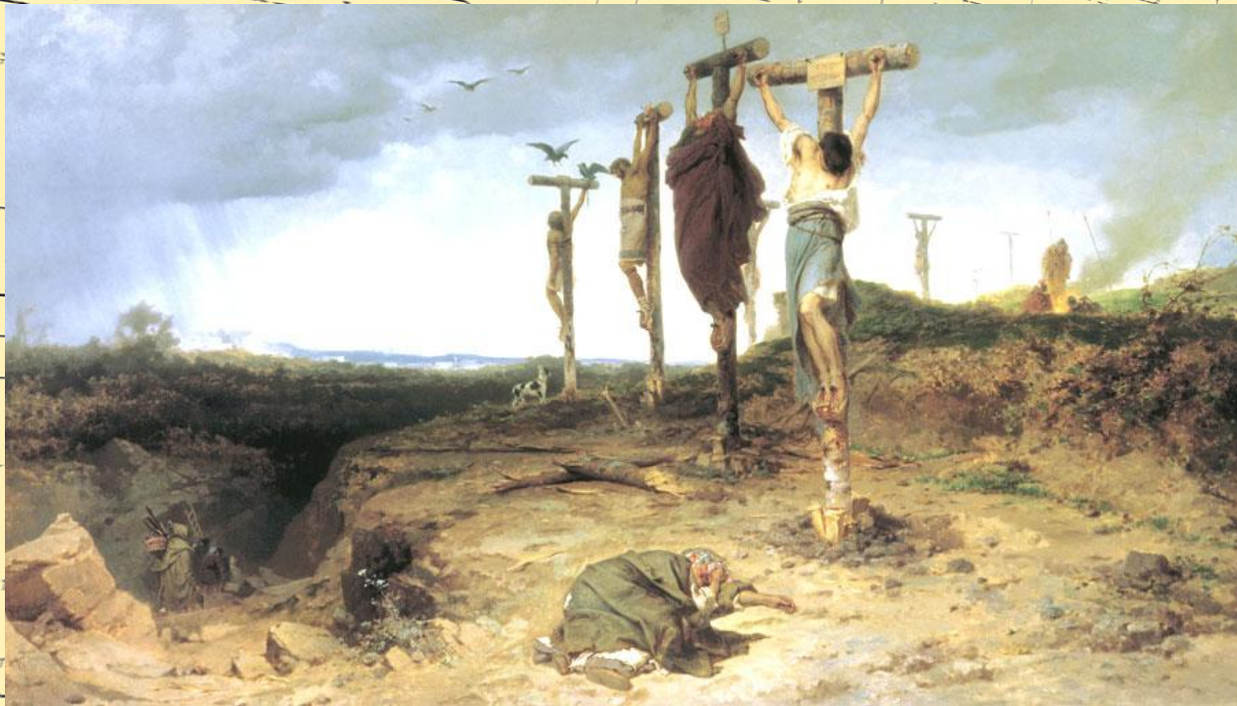
Ф.Бронников. Проклятое место. (1878 г.)