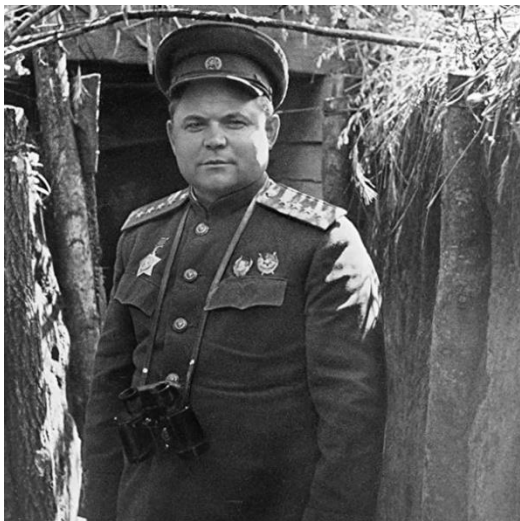
Н.Ф. Ватутин 16.12.1901 – 15.04.1944