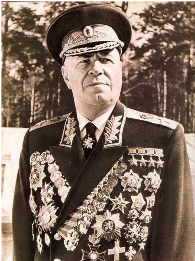
Г.К. Жуков 01.12.1896 – 18.06.1974