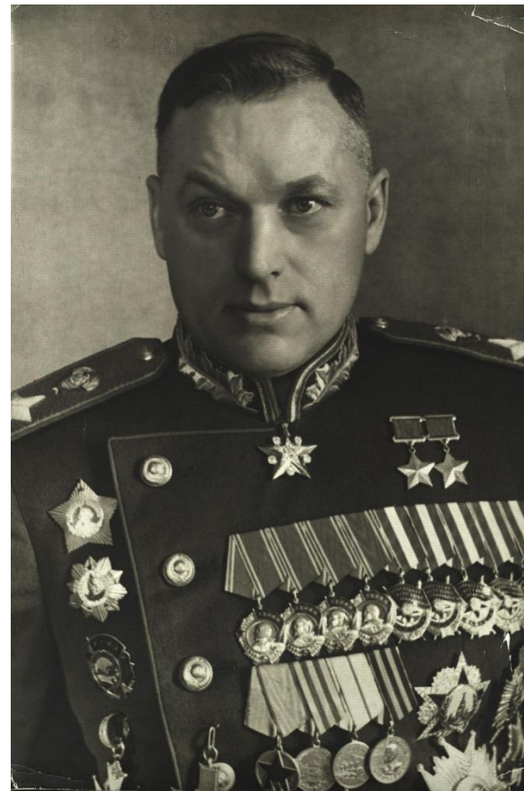
К.К. Рокоссовский 23.12.1896 – 21.08.1968