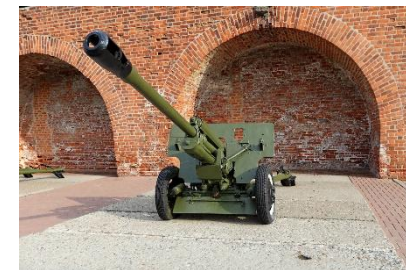
ЗИС-6 (76 мм)