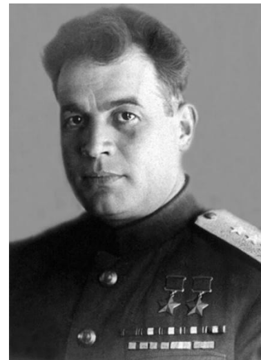
И.Д. Черняховский 29.06.1907 – 18.02.1945