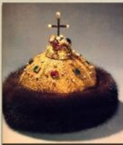
Сословно- представительная монархия XVI - XVII вв.