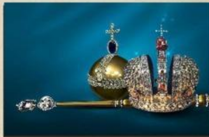
Абсолютная монархия XVIII в.