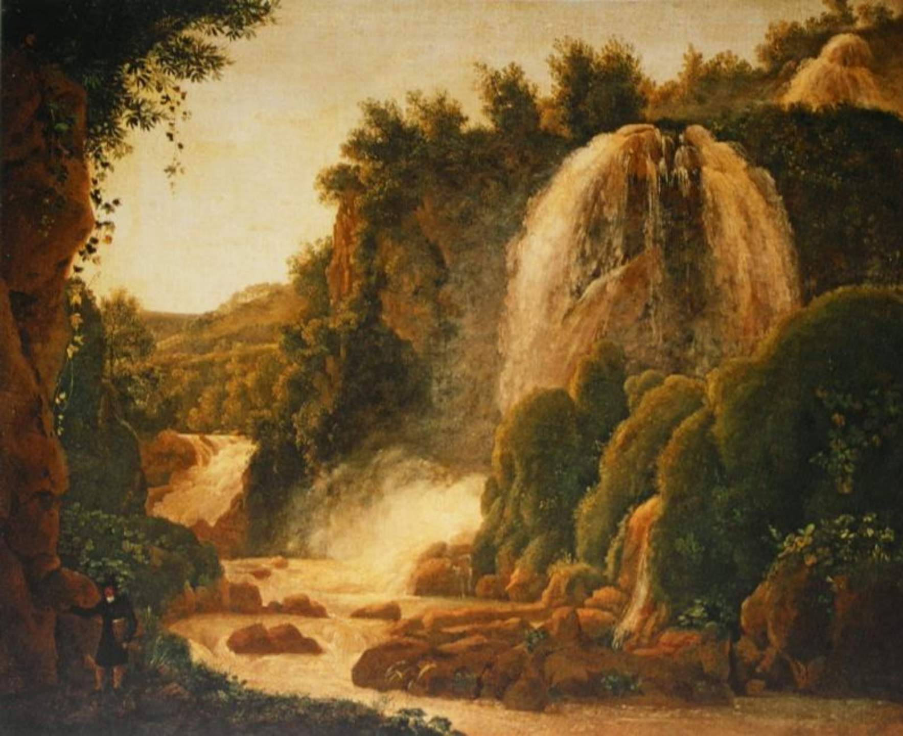
«Водопад в Тиволи близ Рима».