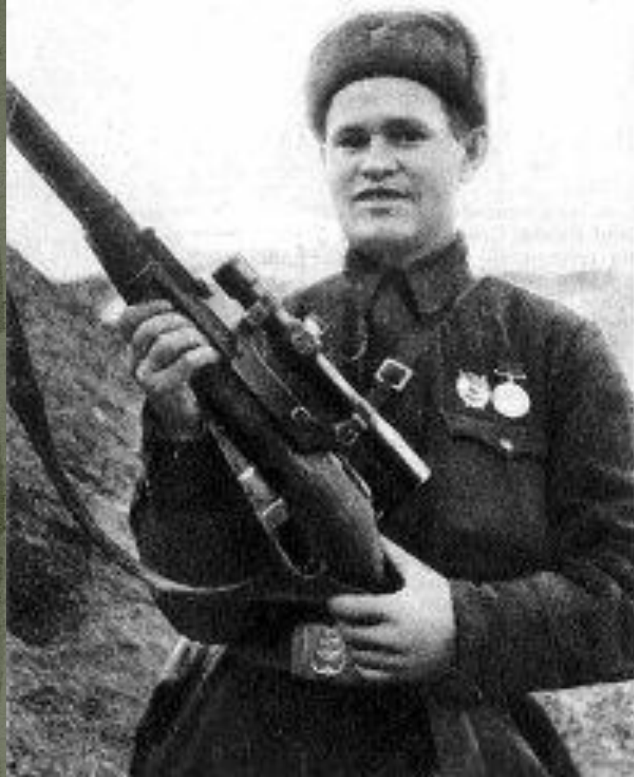
Vasily Zaitsev in Stalingrad, October 1942

Советлар Союзы Герое Василий Зайцев. Снайпер. 1942 елның 10 ноябреннән 17 декабрьгә кадәрге чорда 225 немец солдаты һәм офицерын юк итә. Аларның 11е немец снайперлары була. Шуларның берсе танылган немец снайперы Хейнц Хорваль. Зайцев һәм Хорвальдның дуэле турында “Ангелы смерти” һәм “Враг у ворот” фильмнары төшерелгән.