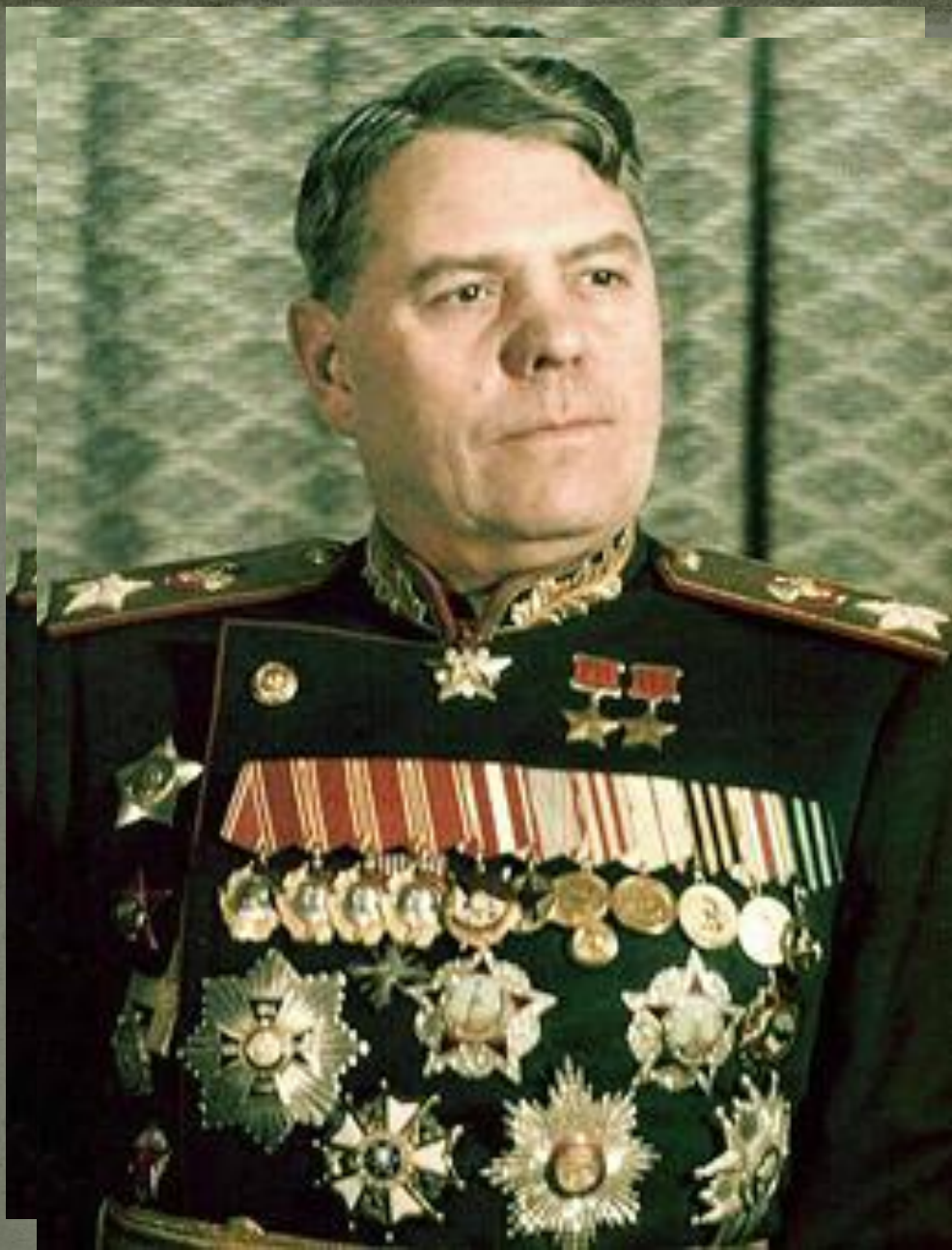
2 тапкыр Советлар Союзы Герое Василевский Алексей Михайлович