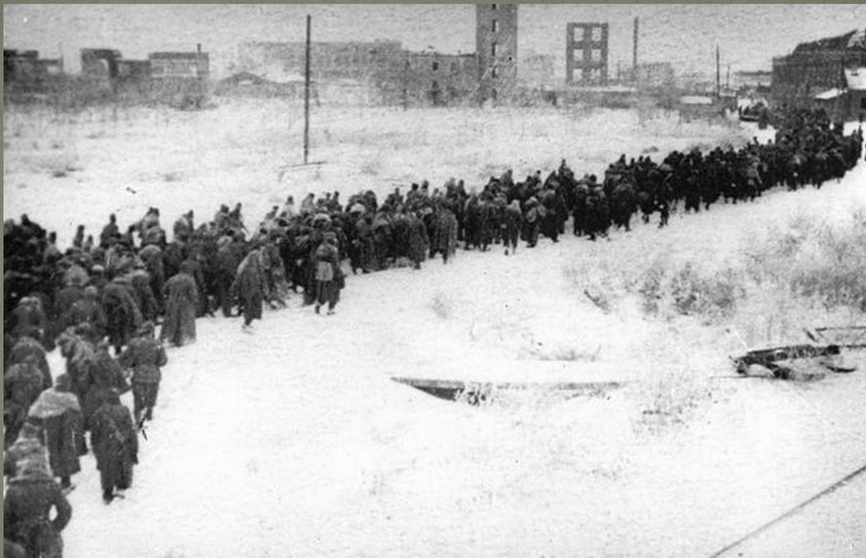
Әсир төшкән немец солдатлары.