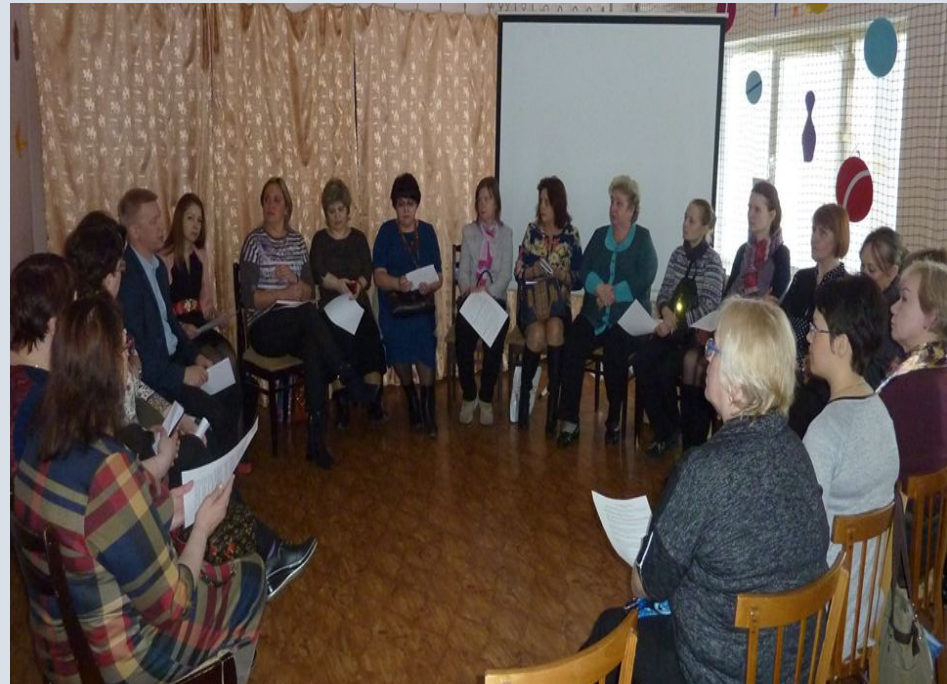
Круглый стол с приёмными родителями и специалистами служб сопровождения городов Апатиты, Кировск, Оленегорск, Мончегорск, Кандалакша и Мурманск