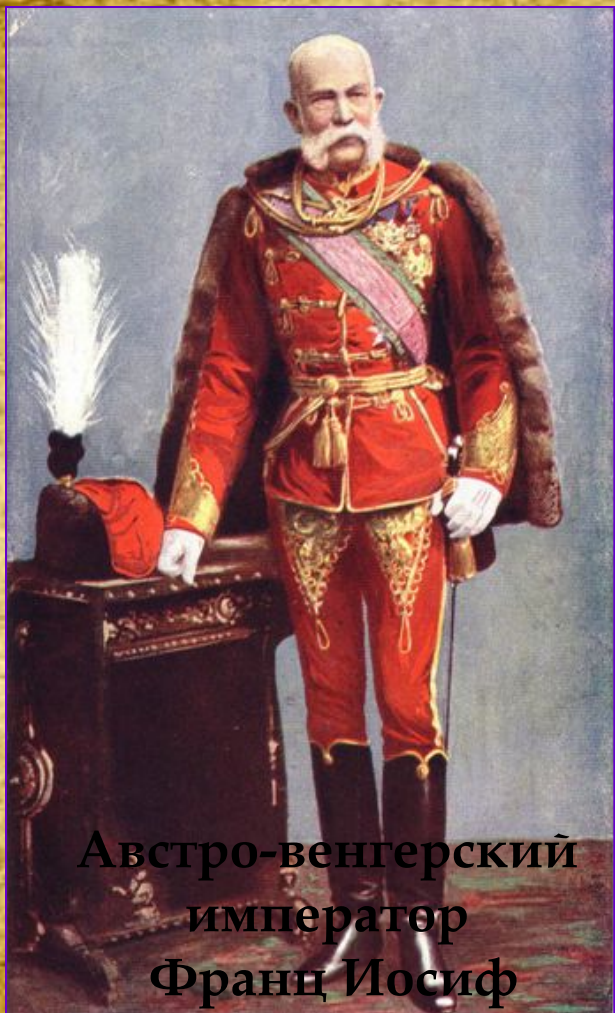
Австро-венгерский император Франц Иосиф

Австро-венгерское правительство дало Сербии 48 часов для выполнения ряда ультиматумов