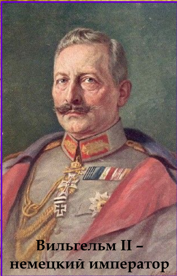
Вильгельм II – немецкий император

После гибели эрцгерцога немецкий император Вильгельм II предложил австро-венгерскому императору Францу-Иосифу «покончить с сербами», используя сараевское убийство как повод для провозглашения войны