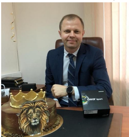
Горбачев И.В. ЗЛ **** TIENS