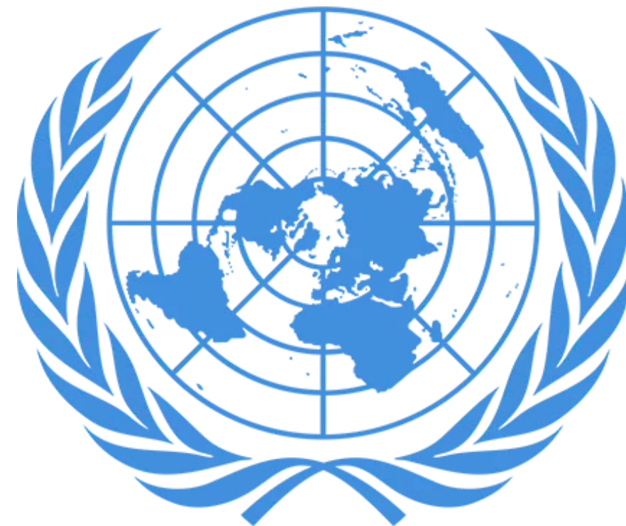
Герб Организаций Объединенных Наций

Организация Объединенных Наций является уникальной международной организацией. Она была основана после Второй мировой войны представителями 51 страны, являвшимися сторонниками курса на поддержание мира и безопасности во всем мире, развитие дружеских отношений между странами и оказание содействия социальному прогрессу, улучшение условий жизни и положения дел в области прав человека.