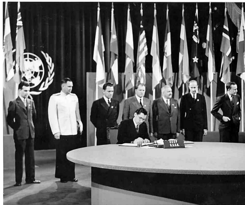
Конференция Объединенных Наций по созданию международной организации, 1945 г.

Польша, не представленная на Конференции, подписала его позднее и стала 51-м государством-основателем.