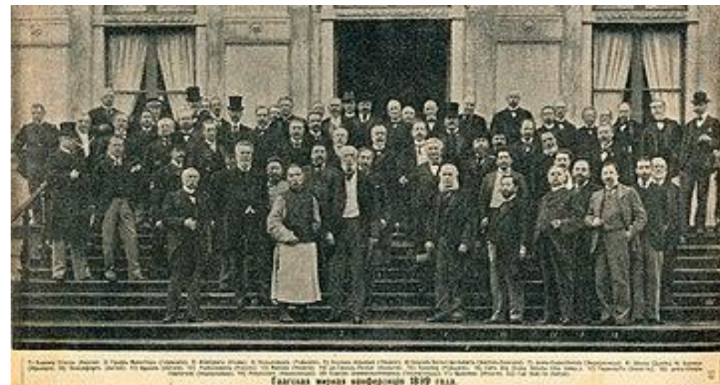
Первая Международная конференция мира, 1899 г.

Конференция приняла Конвенцию о мирном решении международных столкновений и учредила Постоянную Палату Третейского Суда, которая начала свою работу в 1902 году.