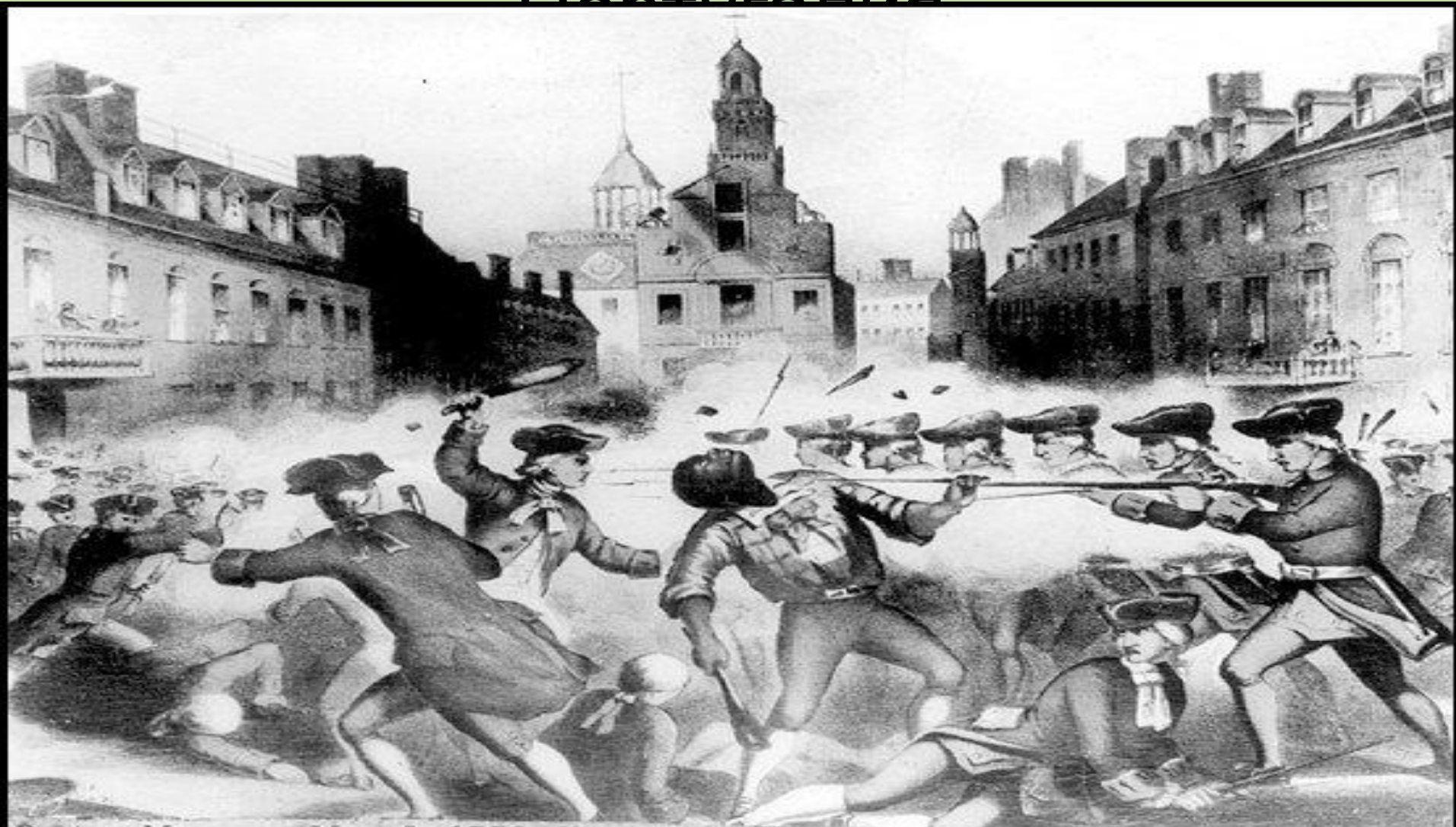
The Boston Massacre, March 5, 1770.