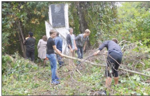
Субботник после уроков.