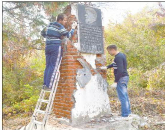
Студентами за работой.

Работы планируют завершить до конца года