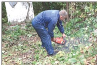
На расчистке территории у памятника.