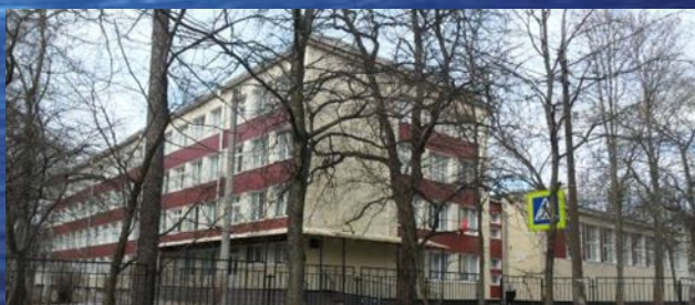
музей ГБОУ № 76 «Детство, опаленное войной»