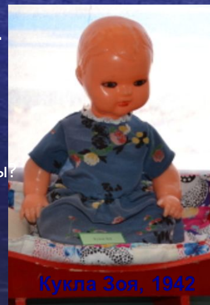
Кукла Зоя, 1942

Я надену кукле бусы, Платье новое сошью. Не вести же мне к бабуся В старом куколку мою.